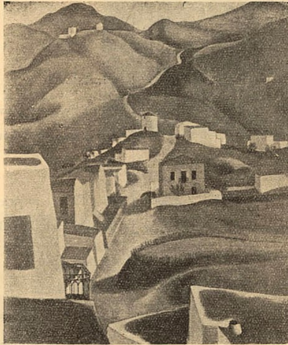
Γ. Β. ΠΕΣΚΕ «Δρόμος για τους μύλους»