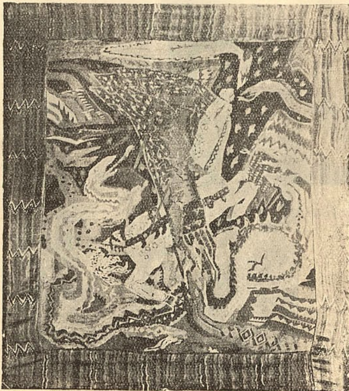
Π. ΔΙΑΜΑΝΤΟΠΟΥΛΟΥ Μπλετίκ