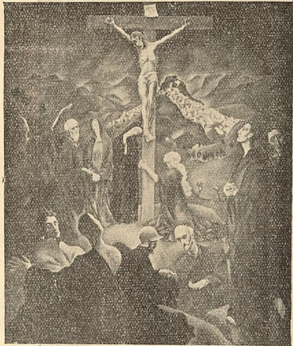
Γ. Β. ΠΕΣΚΕ Σταύρωσις