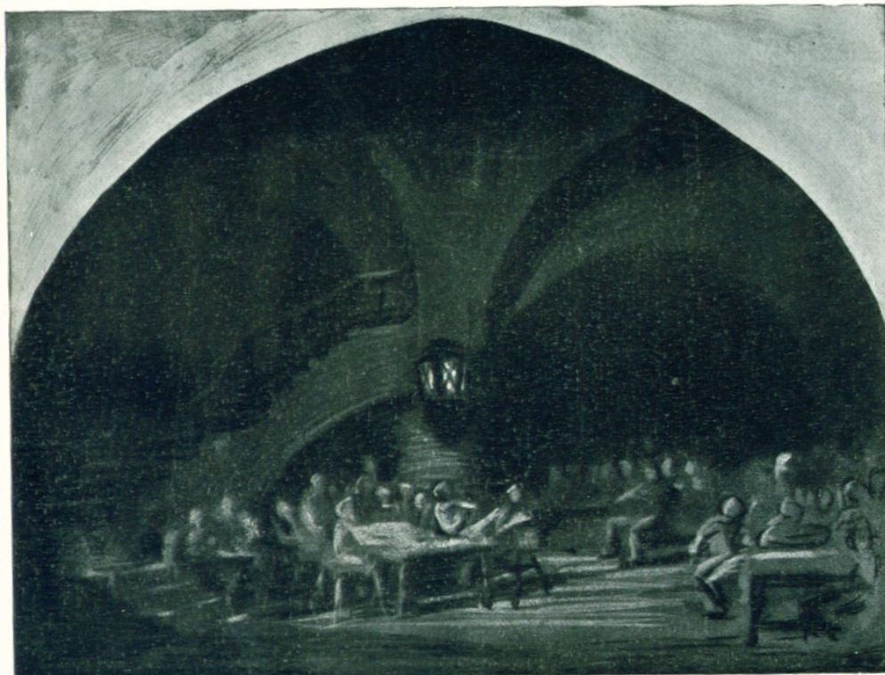
ΦΑΟΥΣΤ - BUSONI