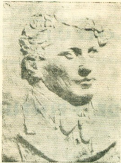
PORTRAIT DE L'ARTISTE Relief du sculpteur HALEPPA