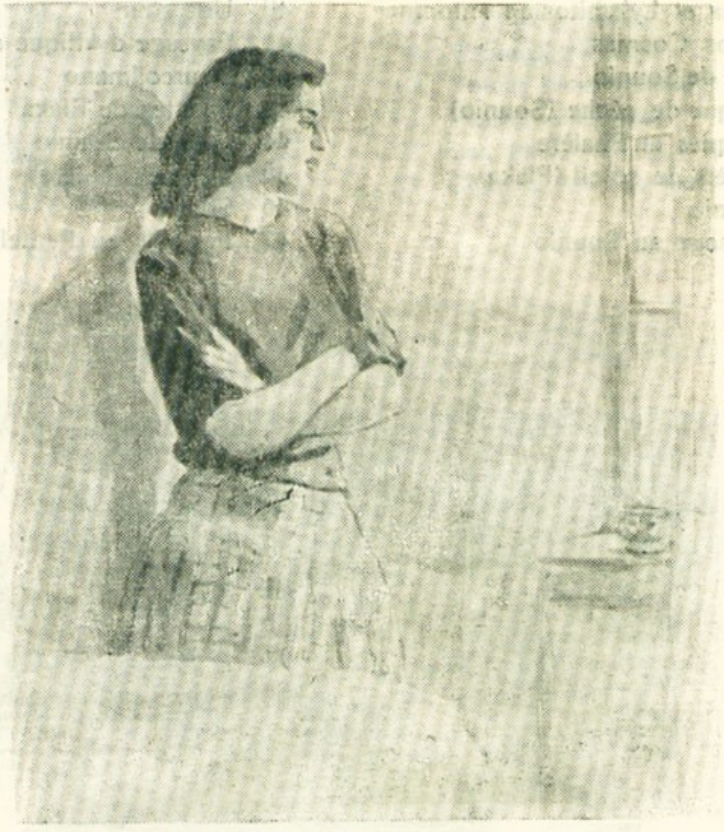
PRES DE LA FENETRE

Adresse de l'Artiste: rue Arcadioupoleos 9, NEA SMYRNI—ATHENES