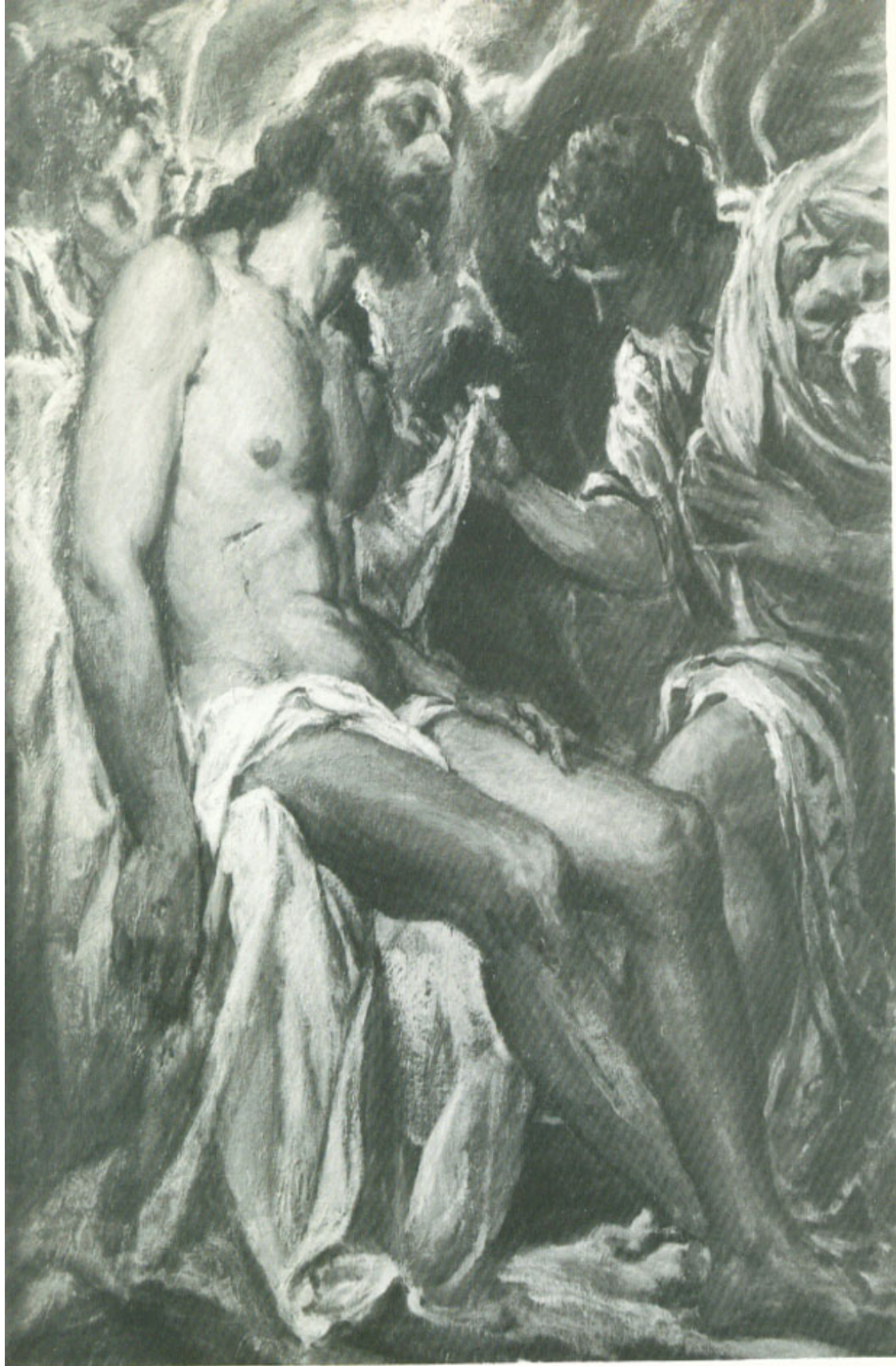
Μεταξύ τῶν Ἀγγέλων