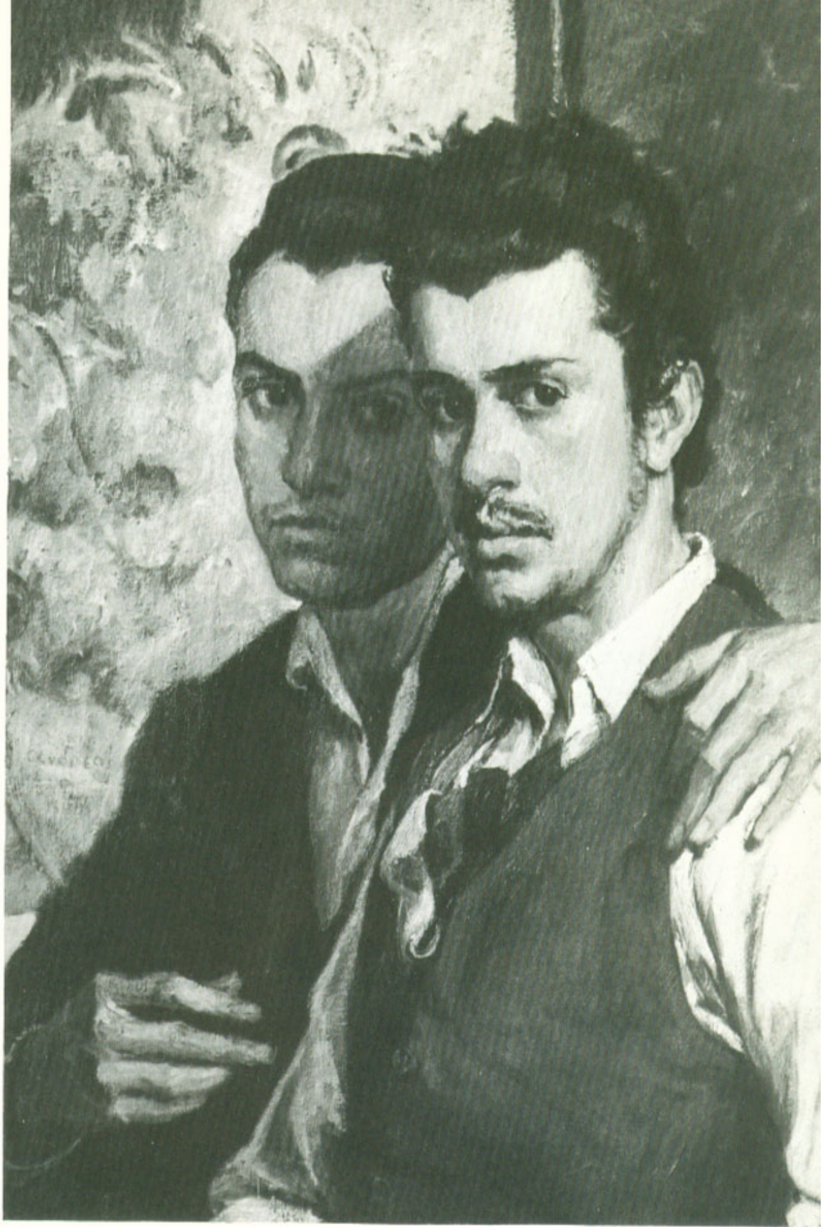
Οι Δύο φίλοι