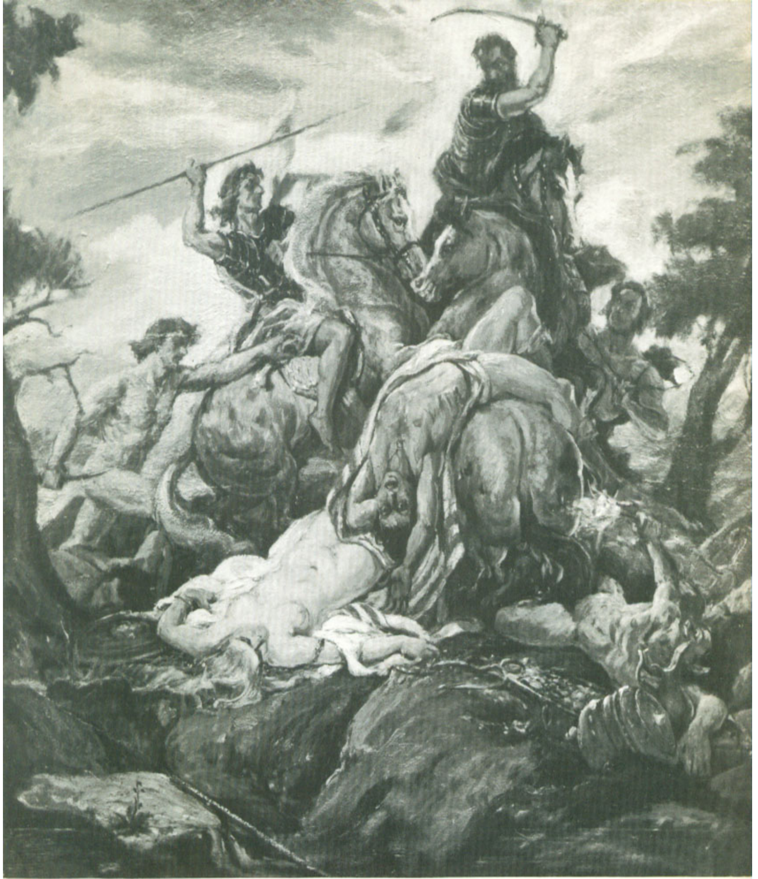
Τὸ μῆλον τῆς Ἑριδος