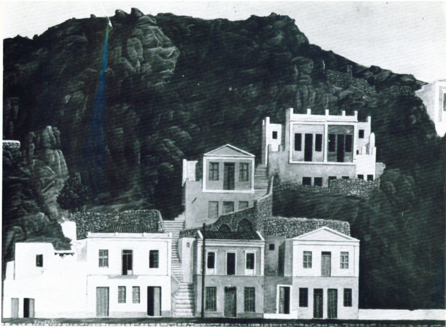
Αύγο: 'Απ' την πατρίδα μου, 50 x 34.