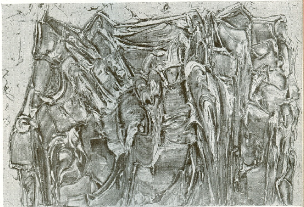
Paysage 1960 Τοπίο 1960