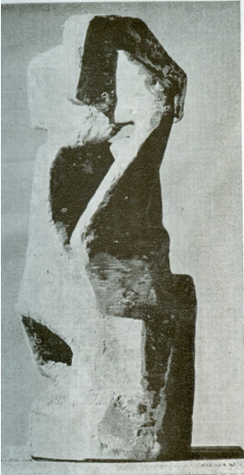
amorphose B αμόρφωση Β