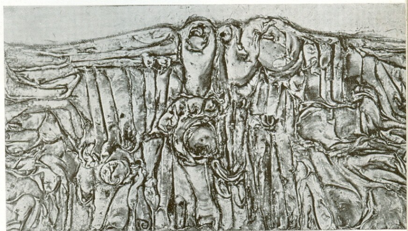
Paysage 1960 Τοπίο 1960