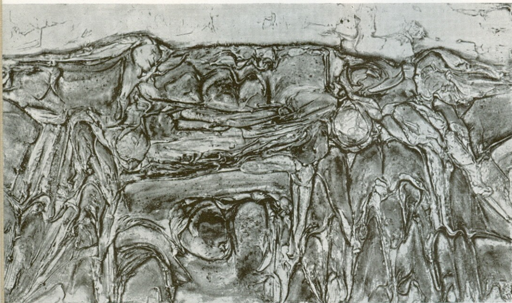
Paysage 1960 Τοπείο 1960