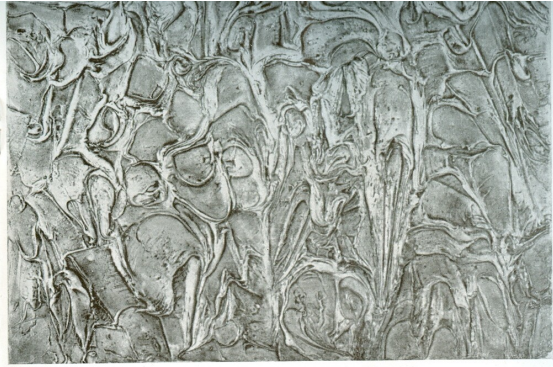
Paysage 1960 Τοπίο 1960