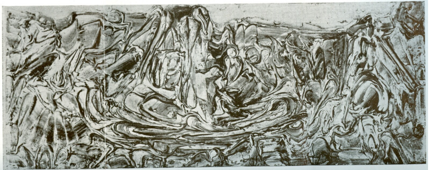
Paysage 1960 Τοπίο 1960