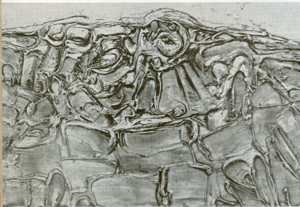
Paysage 1960 Τοπείο 1960