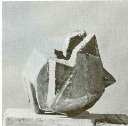
Métamorphose A Μεταμόρφωση Α