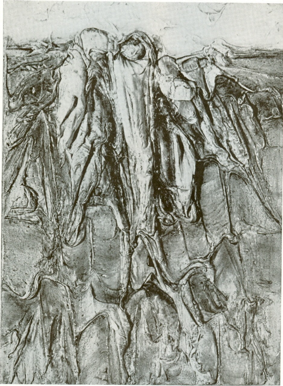
Paysage 1960 Τοπίο 1960