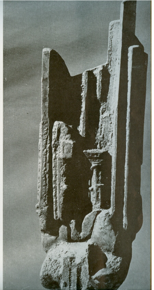
Allégorie B 'Αλληγορία B