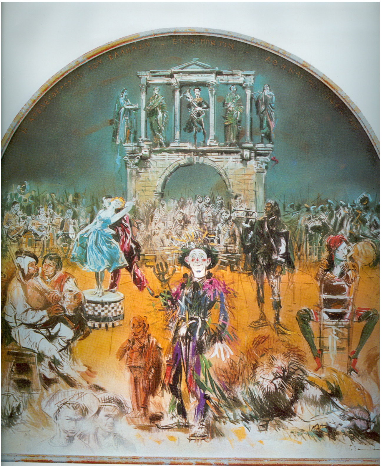
«Παθήσεις τῶν Ἑλλήνων - ἔτος πρῶτον - Ἀθήναι τῆ 1944-45»