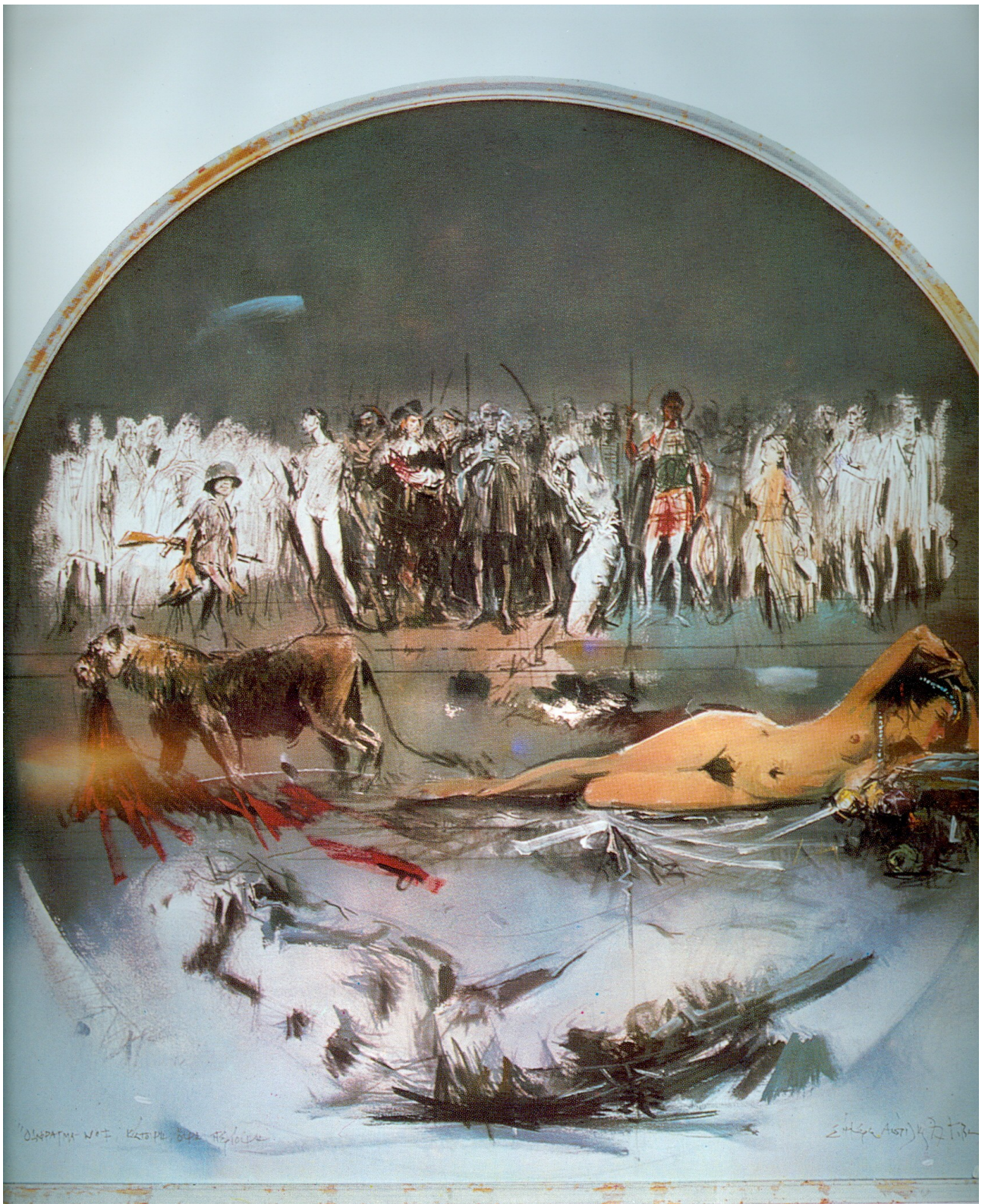
Προαγμα Νο1 (μαινάς, κάτοψη, όψη, περιόψη)»