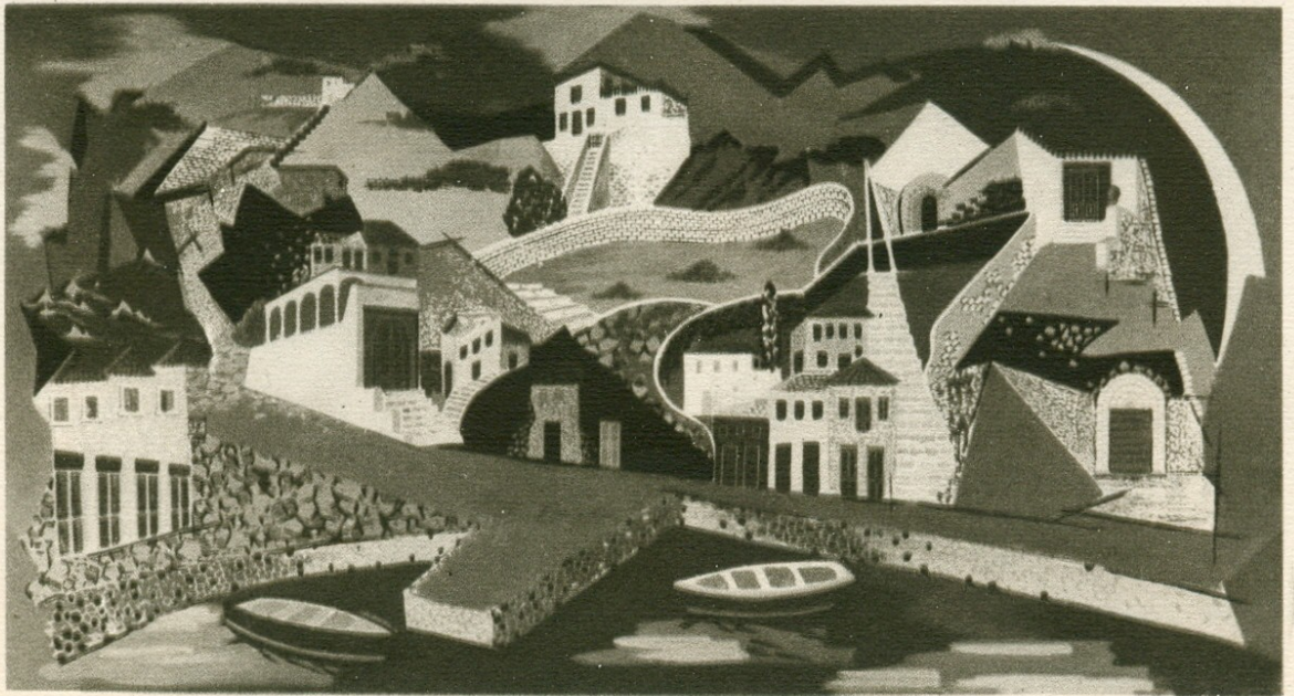
ΕΚΤΥΠΩΣΙΣ ΠΕΡΒΟΛΑΡΑΚΗ - ΛΥΧΟΓΙΑΝΝΗ