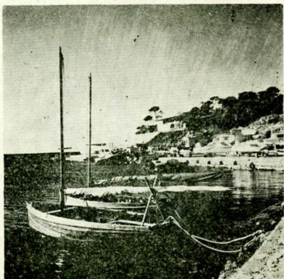
Δύο φωτογραφίες τοῦ καλλιτέχνη κ. Δημήτρη ἀπὸ τὴν περιοχὴ τοῦ «Ναυτικοῦ Ὀμίλου Βουλιαγμένης».