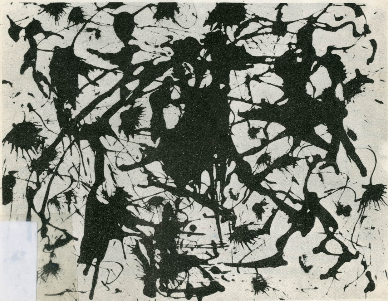
56. JACKSON POLLOCK

ΔΙΟΧΥΑ "ΑΘΗΝΑΪΚΟΥ ΤΕΧΝΟΛΟΓΙΚΟΥ ΙΝΣΤΙΤΟΥΤΟΥ"