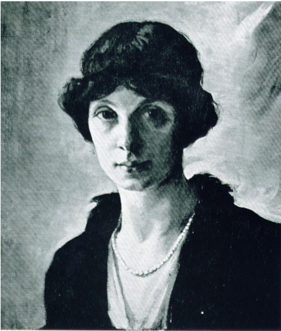
Πορτραίτο της Κας Α. Κ.

σε, αν θά θέλαμε, νά δουλέψη κι' αὐτὸς μαζί μας. Τὴν ἄλλη μέρα κι' ὅλας κατέφθασε μὲ ἕνα αὐτοκίνητο γεμάτο σύνεργα ζωγραφικῆς καὶ μὲ μιὰ περίφημη θερμάστρα. Μᾶς ἔδειξε μερικὲς σπουδὲς ποὺ ἔκανε στὴν Ἄνδρο, ἦταν ὅμως ὅλες ἐπιηρεασμένες ἀκόμα ἀπὸ τὸν γερμανικὸ ἔμπρεσιονισμό τοῦ Μονάχου καὶ δὲν τοῦ ἄρεσαν τοῦ ἴδιου.