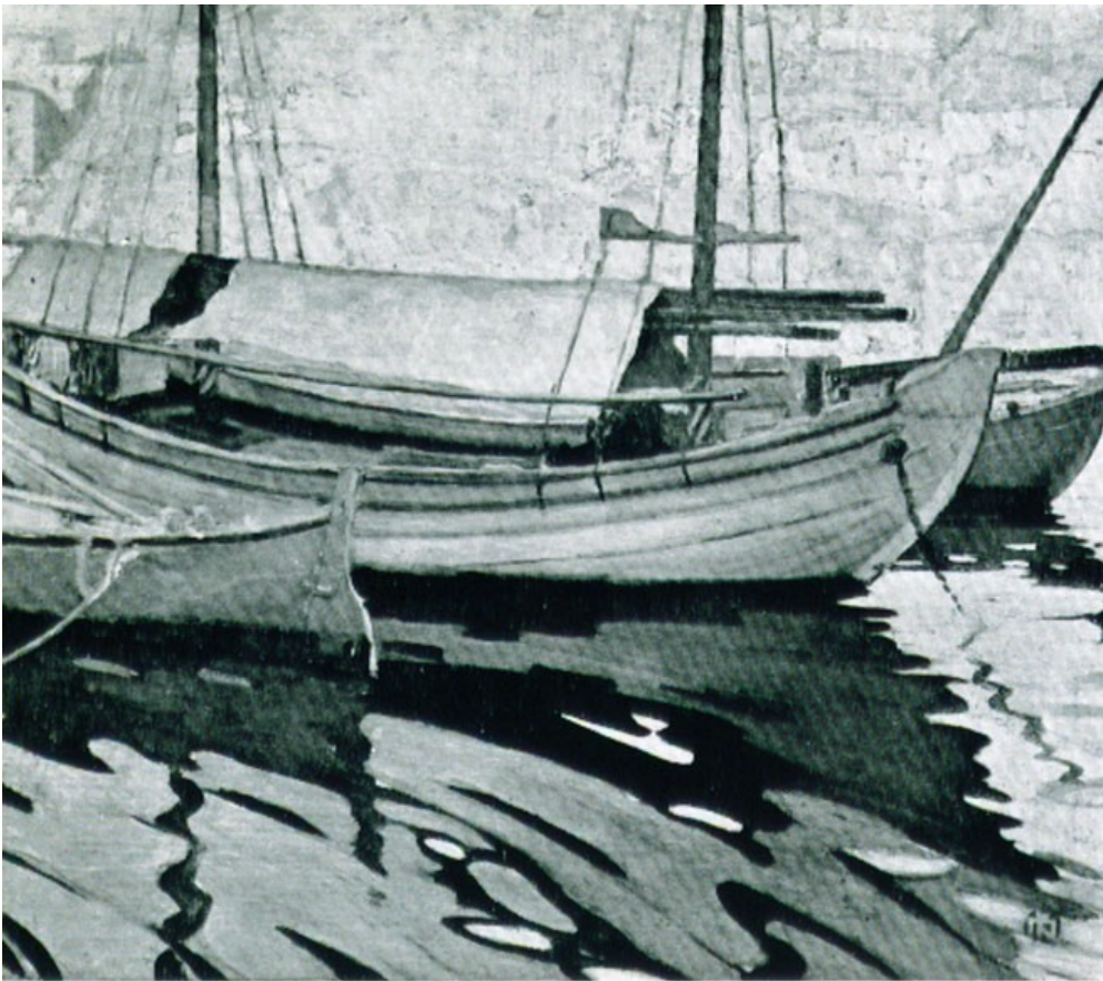
Καΐκια στην Ύδρα

έπειδή όμως, φύσει ελεύθερος, δέν ήθελε νά κλεισθῆ στό μικρό περιβάλλον τῆς Ἀθήνας, ἔφυγε γιά νά σπουδάσῃ στήν Ὁξφόρδη χημικός.