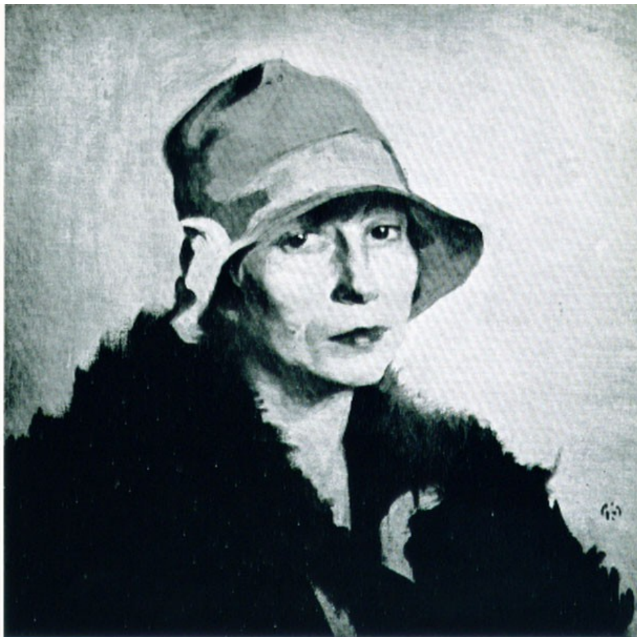
Πορτραίτο της Κας Κ. Κ.

στήν Ἀθήνα καί πού ἀργότερα κρατικοποιήθηκε μέ τόν τίτλο «Στέγη Γραμμάτων καί Τεχνῶν». Μέσα σ' αὐτή τή συντροφιά βρισκόταν καί ὁ Ζαχαρίας Παπαντωνίου καί ἕνα βράδυ ἔπεισα τόν Παῦλο νά τοῦ δείξῃ τά ἔργα του. Ὁ Παπαντωνίου ἐνθουσιάστηκε καί τοῦ εἶπε πῶς ὅπωςδήποτε ὀφείλει νά τά ἐκθέσῃ. Καί πράγματι τὸ 1927 τὰ ἐξέθεσε στήν Γκαλερί Στρατηγοπούλου, στήν ὁδόν Φιλελλήνων. Ἡ ἐπιτυχία ἦταν ἀπόλυτη. Ὁ Παπαντωνίου, ὁ Φῶτος Πολίτης, τόν ἔφεραν γιά παράδειγμα στούς νέους καλλιτέχνες. Ἡ ἀπλότης τῶν χρωμάτων, ἡ εὐαισθησία του ἔδειχναν τότε ἕνα καινούργιο δρόμο γιά τήν κατάκτησι τοῦ ἐλληνικοῦ ὑπαίθρου.