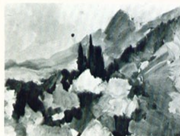
«Τό άπέναντι βουνό».