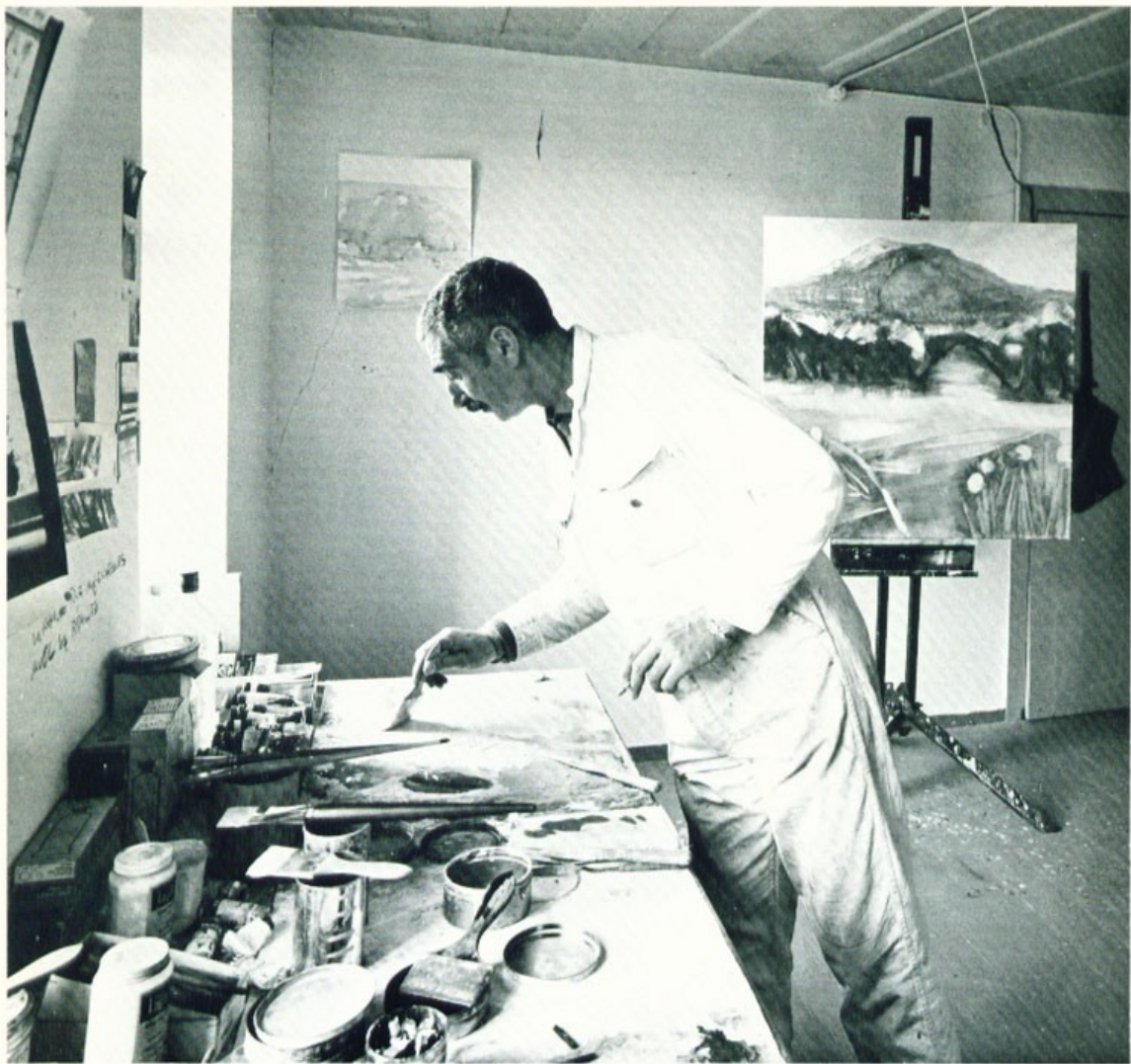
Παλέττα του είναι τὸ τραπέζι. Πάνω ἐκεῖ ἐτοιμάζει τὰ χρώματα.

Ὁ κατάλογος εἶναι ἀνάτυπο ὑπὸ τὸ περιοδικὸ «Ζυγός», τεύχος Ἀπριλίου 1973.