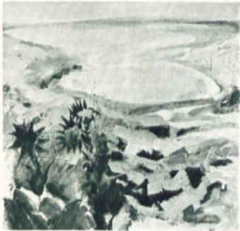
«Η Θάλασσα και τ' άγκάθια».