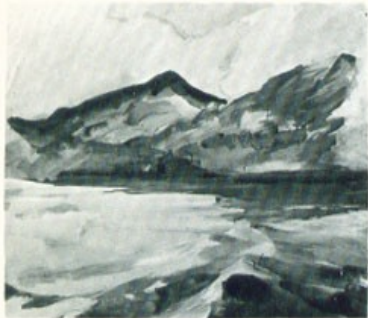
«Φθάνοντας στην Λέσβο».