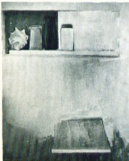
«Ο πίνακας και τό τραπέζιο».