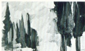
«Τα κυπαρίσσια του κήπου μου».