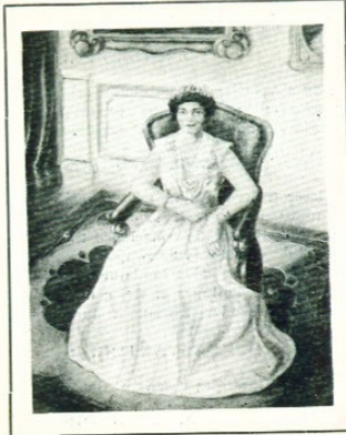
Πορτραίτο Βασιλίσσης Φρειδερίκης. Portrait de Sa Magesté la Reine Frédérique