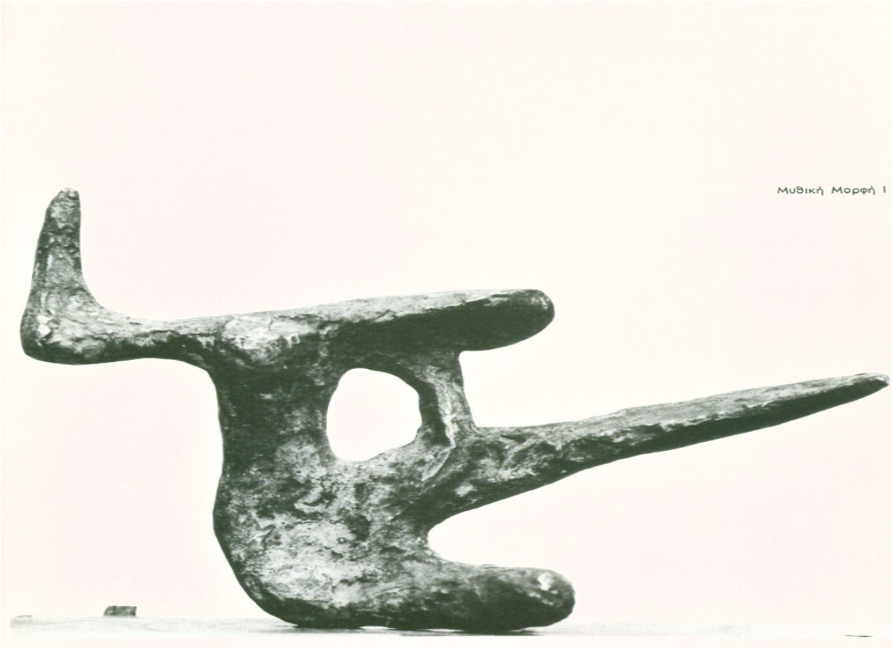
Μυθική Μορφή I