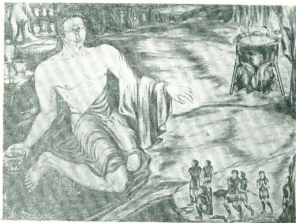
Ο ΠΟΛΥΦΗΜΟΣ ΣΤΟ ΣΠΗΛΑΙΟ ΤΟΥ

Ἡ ἀτμόσφαιρα τῆς σκηνῆς εἶναι βαρειά καὶ βίαιη. Τὸ σκληρὸ λουλακί χρῶμα τῆς θάλασσας χτυπιέται μὲ τὸ κόκκινο πολυκέφαλο φιδίσιο θηρίο. Τὸ λευκὸ πανί τοῦ καραβιοῦ γίνεται ἕνα σινιάλο σωτηρίας, στὴν καταιγίδα καὶ στὴ συμφορὰ ποὺ πλησιάζει. Στὴν ἀπειλὴ δὲν ὑπάρχει ἔλεος. Ἡ ζωγράφος ἀποκαλύπτει ἕνα πάθος ἐπιθετικὸ, μιά ἡδονή γιὰ τὰ τρομερὰ ποὺ θὰ συμβοῦν. Ἐχει τὴν ὑπομονὴ νὰ σχεδιάζῃ, μὲ ἀσυναγώνιστη μικρογραφικὴ λεπτομέρεια, τοὺς ὀπλίτες, τὰ δοῖτια τοῦ θηρίου, τὰ φυλλώματα τῆς συκιάς, γιὰ νὰ μᾶς μεταδώσῃ, μὲ ὅση μπορεῖ περισσότερη δύναμη, τὴ φρεναπάτη τοῦ πραγματικοῦ καὶ χεροπιαστοῦ γεγονότος. Θέλει νὰ μᾶς τρομάξῃ, γιὰτὶ ζῆ ἡ ἴδια στὸ ψυχικὸ αὐτὸ κλίμα τῆς ἐνστικτώδους ἀντεπίθεσης μὲ τὴν ἀπειλὴ τοῦ τρόμου. Καὶ τὸ ἔργο τῆς ἔχει γνησιότητα καὶ ἀλήθεια μέσα στὸν ἀπίθανο μῦθο του.