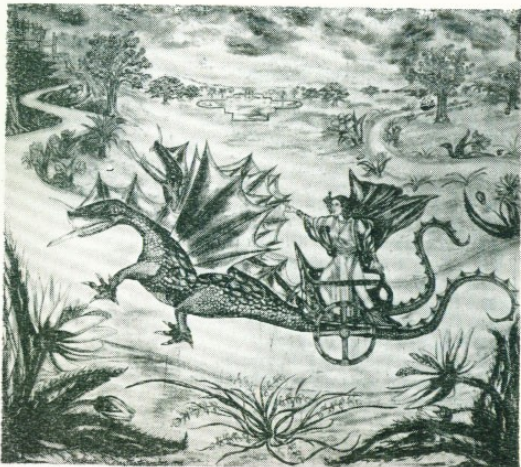
Η ΜΗΔΕΙΑ ΕΠΙΣΤΡΕΦΕΙ ΣΤΗΝ ΚΟΛΧΙΔΑ