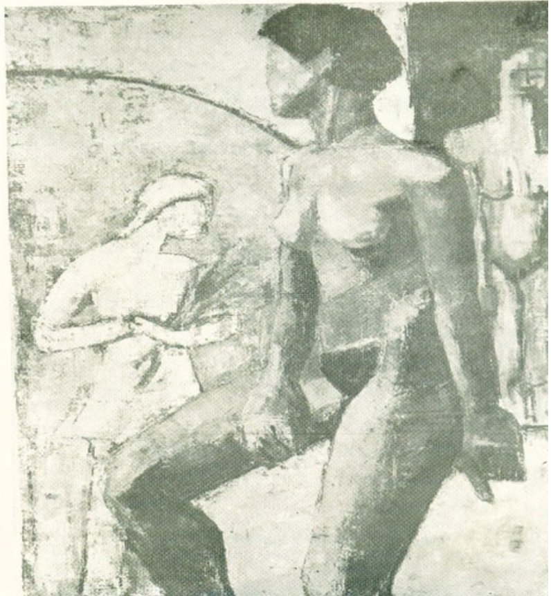
ΣΥΝΘΕΣΗ ΜΕ ΓΥΜΝΟ

Σπούδασε στην Academie Julian στον Δασκαλο Pleason. Τό 1957 στην Ecole des Beaux Arts κοντά στον Souverbie. Συμμετοχή στο Salon des Artistes Français 1957 και Salon des Artistes Français 1958. Πήρε τιμητικό έπαινο.