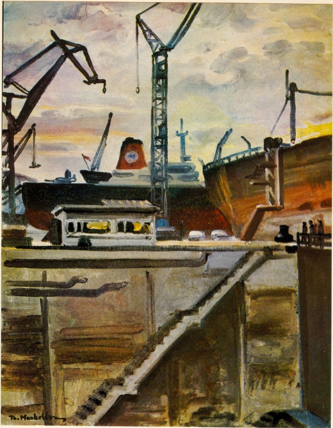
ΒΑΠΟΡΙΑ ΣΤΗ ΛΥΣΗ