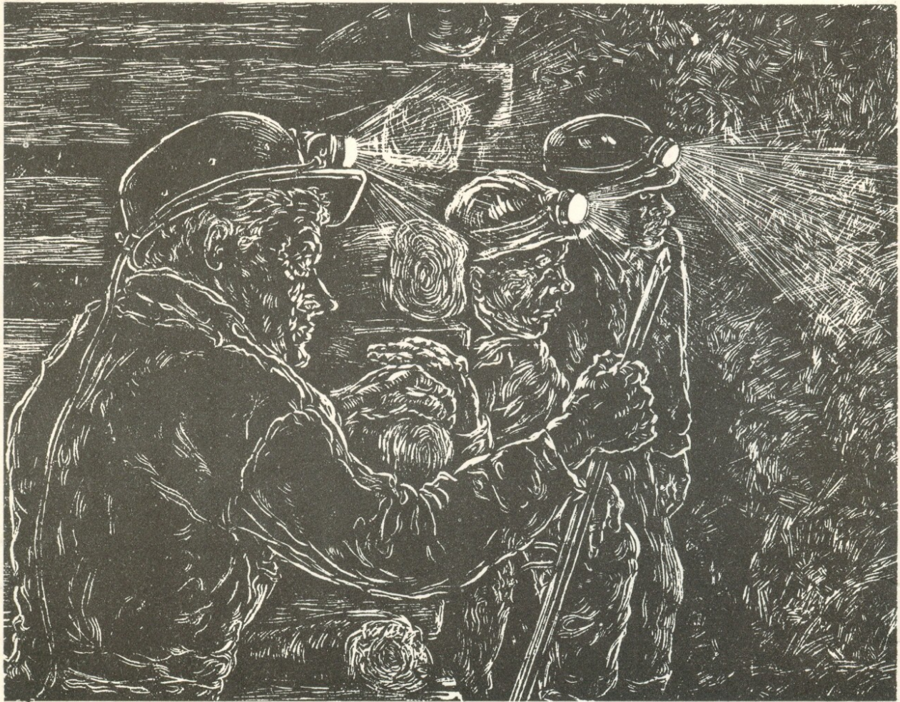
Βάρδα φουρνέλο, ξυλογραφία

‘Ο ανθρώπινος μόχθος, αυτή ή μεταμορφωτική δύναμη που μάς φανερώνει τὰ μυστικά του φυσικού κόσμου, ήταν πάντα τὸ βασικό στοιχείο για τὴν αἰσθητική μου συγκίνηση καὶ τὸ ἀσίγαστο κίνητρό μου για τὴν αἰσθητική ἔκφραση. Τὸν ἀντίκρουσα σ’ ὅλη τὴν ἐπική του προσπάθεια στὰ μαύρα σπλάχνα τῆς γῆς τοῦ Ἀλιβερίου, ὅπου, χάρι στὸ μόχθο αὐτόν, τὸ γεωλογικὸ σκοτάδι γίνεται φῶς καὶ δημιουργική χαρά. Οἱ πίνακες καὶ τὰ σχέδιά μου εἶναι ἡ ἀπεικόνιση μιᾶς μορφῆς αὐτοῦ τοῦ παντοτεινοῦ ἀγῶνα, που τὸν ἔζησα καὶ προσπάθησα νὰ τὸν ἀποδώσω σ’ ὅλη του τὴν δραματική ζωντάνια καὶ ἔνταση καὶ τὴν ἀνένδοτη ἐπιμονή μαζί μ’ ἐκείνους που γράφουν τὴν πιὸ ὠραία, τὴν πιὸ ἀνθρώπινη ἱστορία.