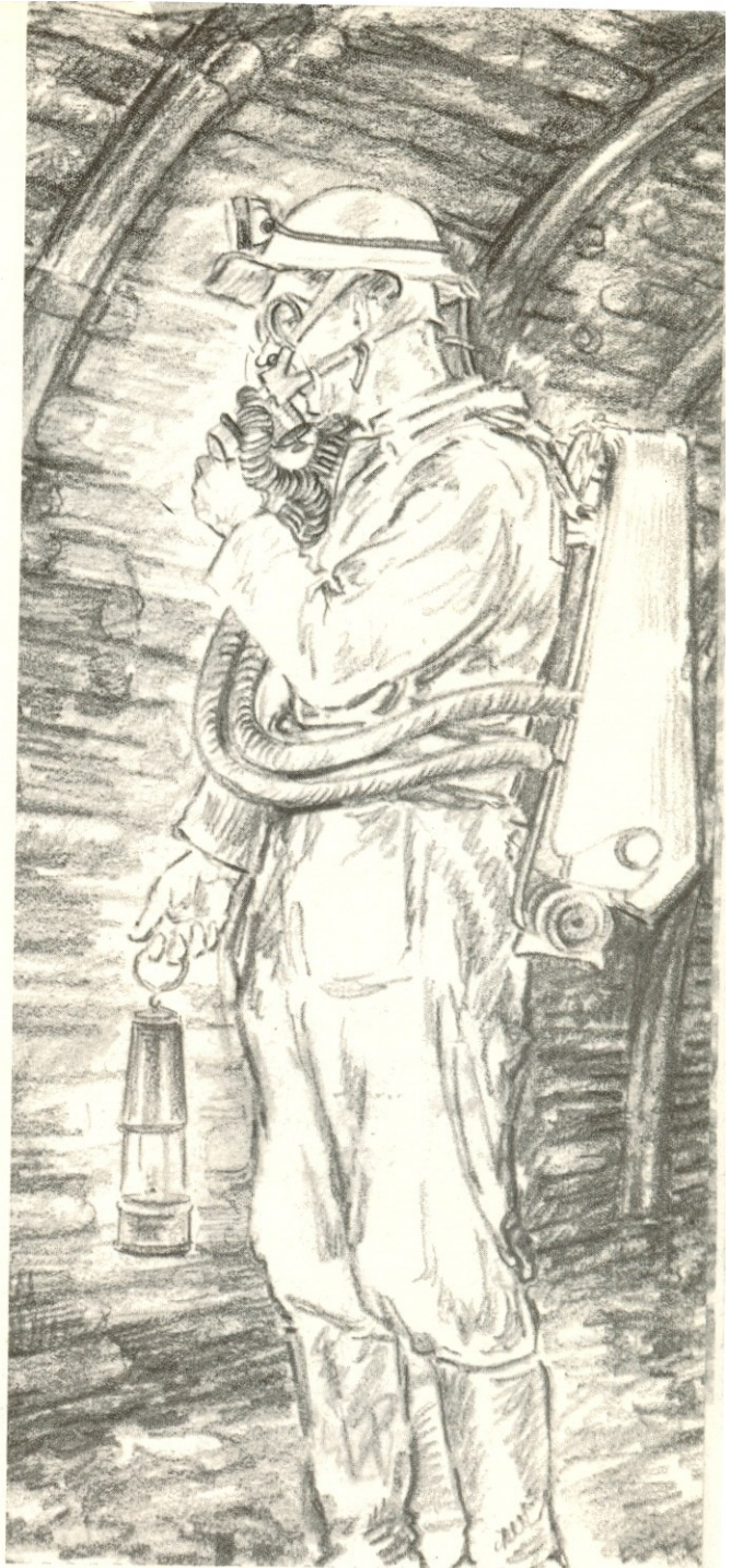
Τò μονοξειδίο, μολύβι