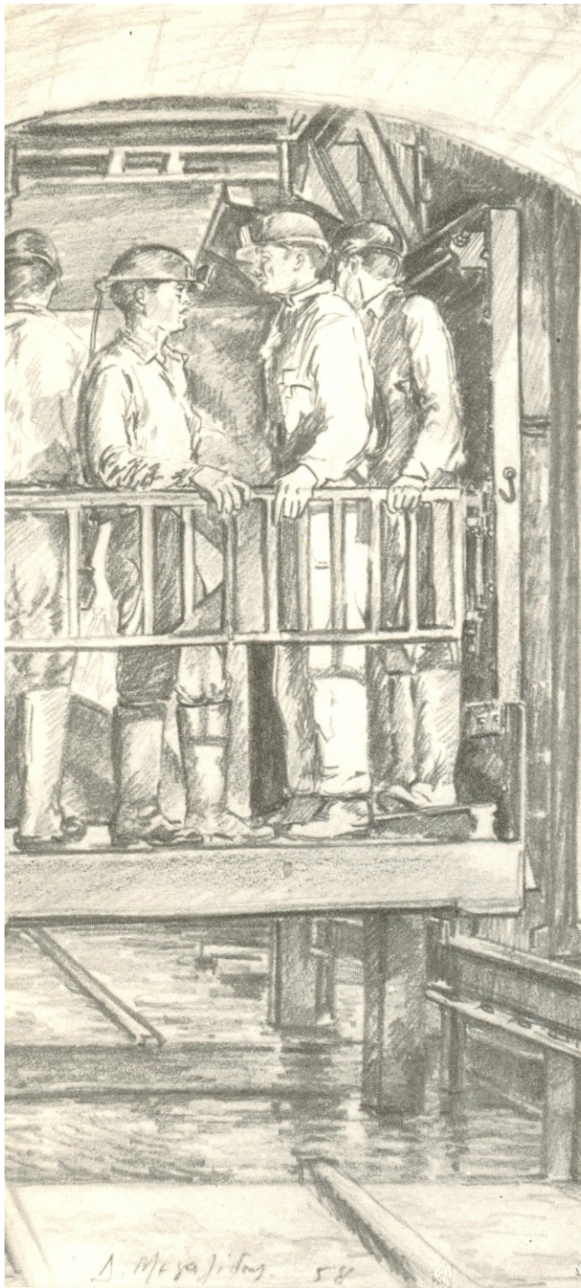
Έπιστροφή στην επιφάνεια, μολύβι