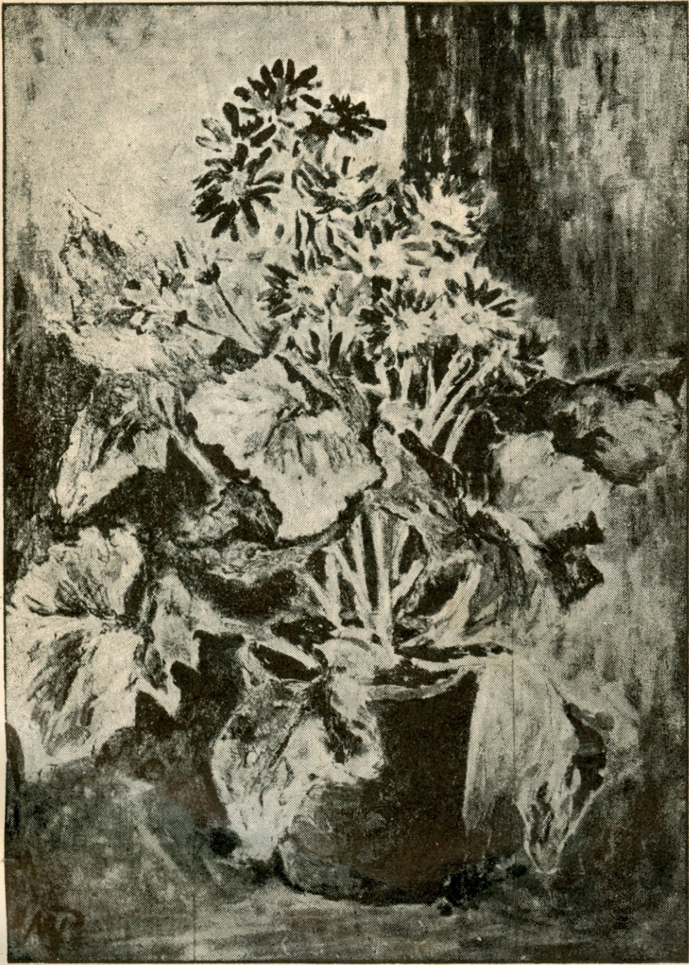
M. ΡΙΓΓΑ: "ΤΖΕΝΕΡΑΛΙΑ"