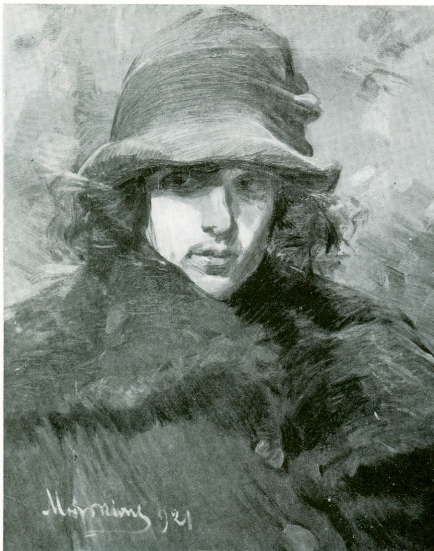
ПОРТРАИТО М. В. (1921)