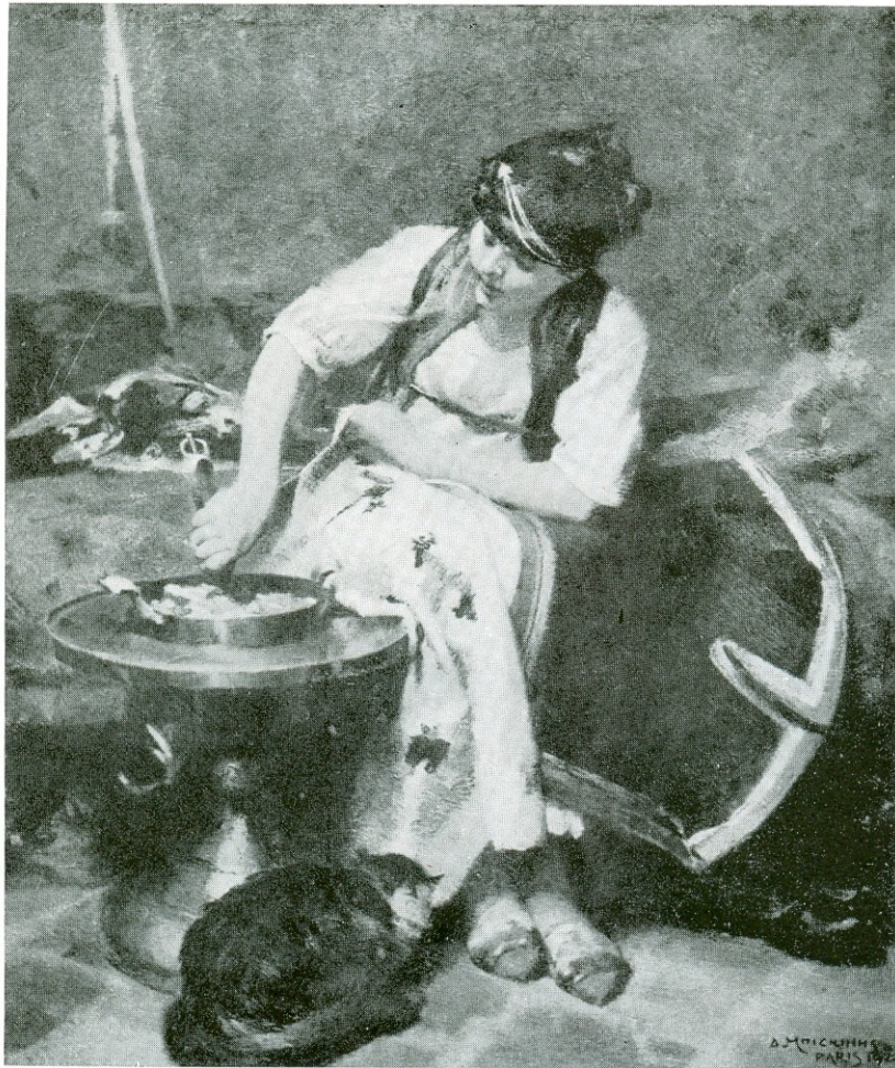
ΜΑΚΕΔΟΝΙΤΙΣΑ ΧΩΡΙΚΗ (1922)