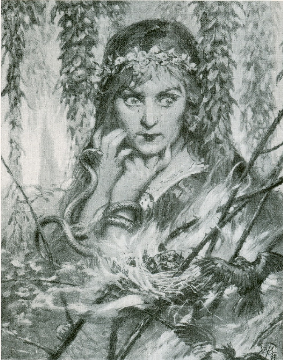
ΟΝΕΙΡΟ ἢ ΠΡΟΦΗΤΕΜΑ (1933)