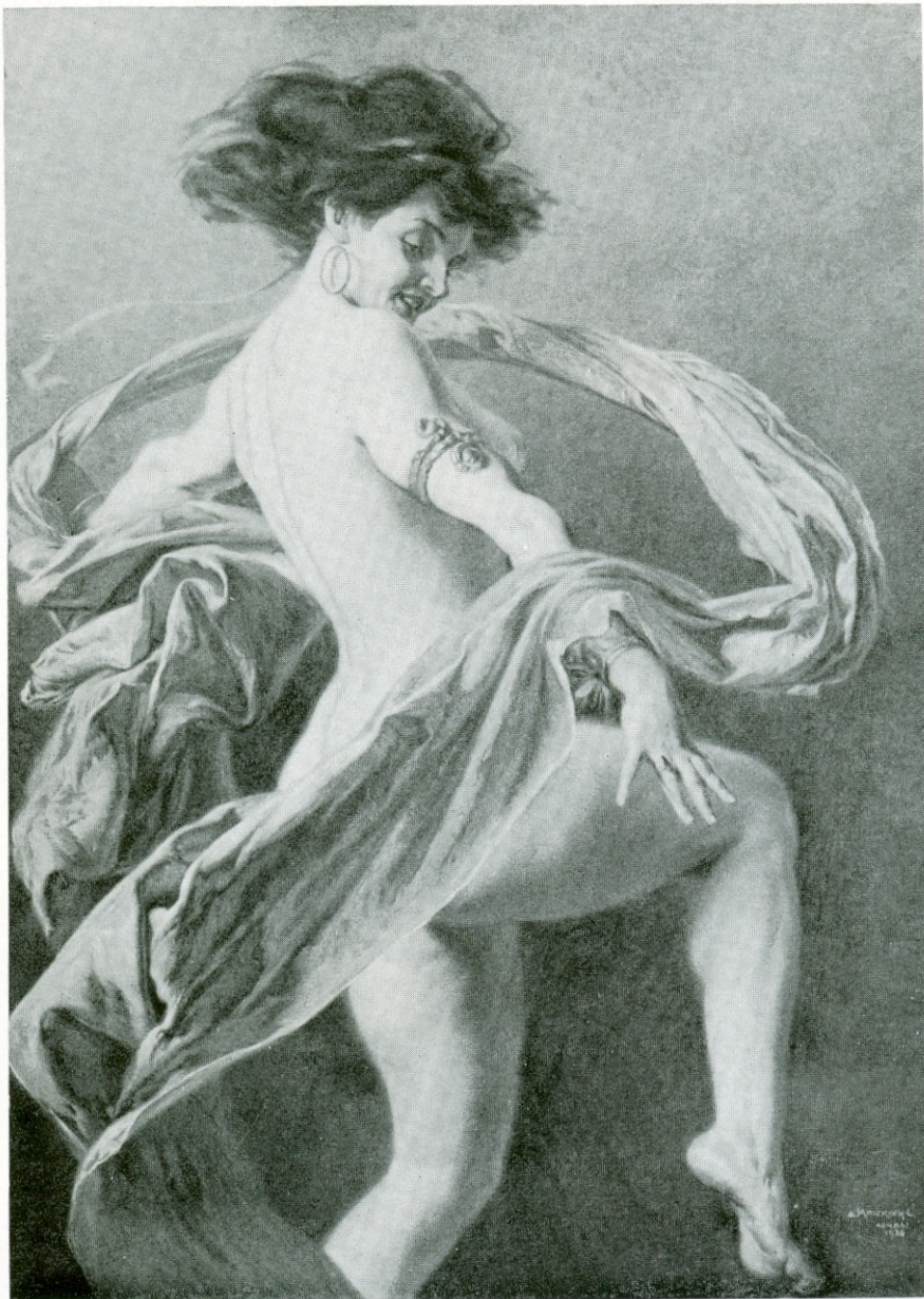
ΣΤΡΟΒΙΛΟΣ ΧΟΡΟΥ (1926)