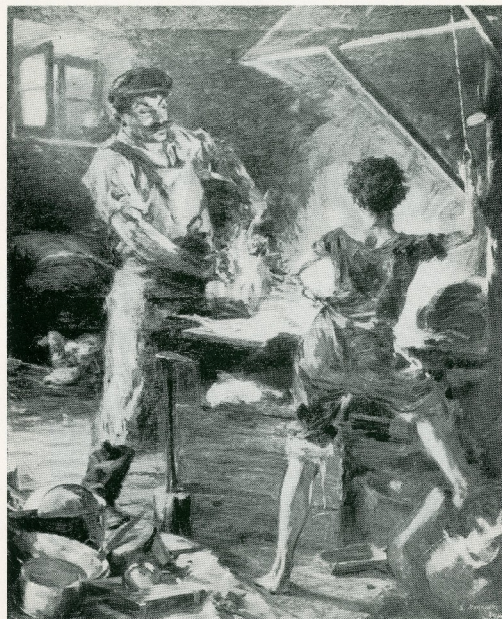
Ο ΓΑΝΩΤΖΗΣ (1914)

(Σχέδια και επιβλεψη ΔΗΜ. Δ. ΜΠΙΣΚΙΝΗ) (Εκτέλεση ΚΕΛΑ-ΤΑΗ)