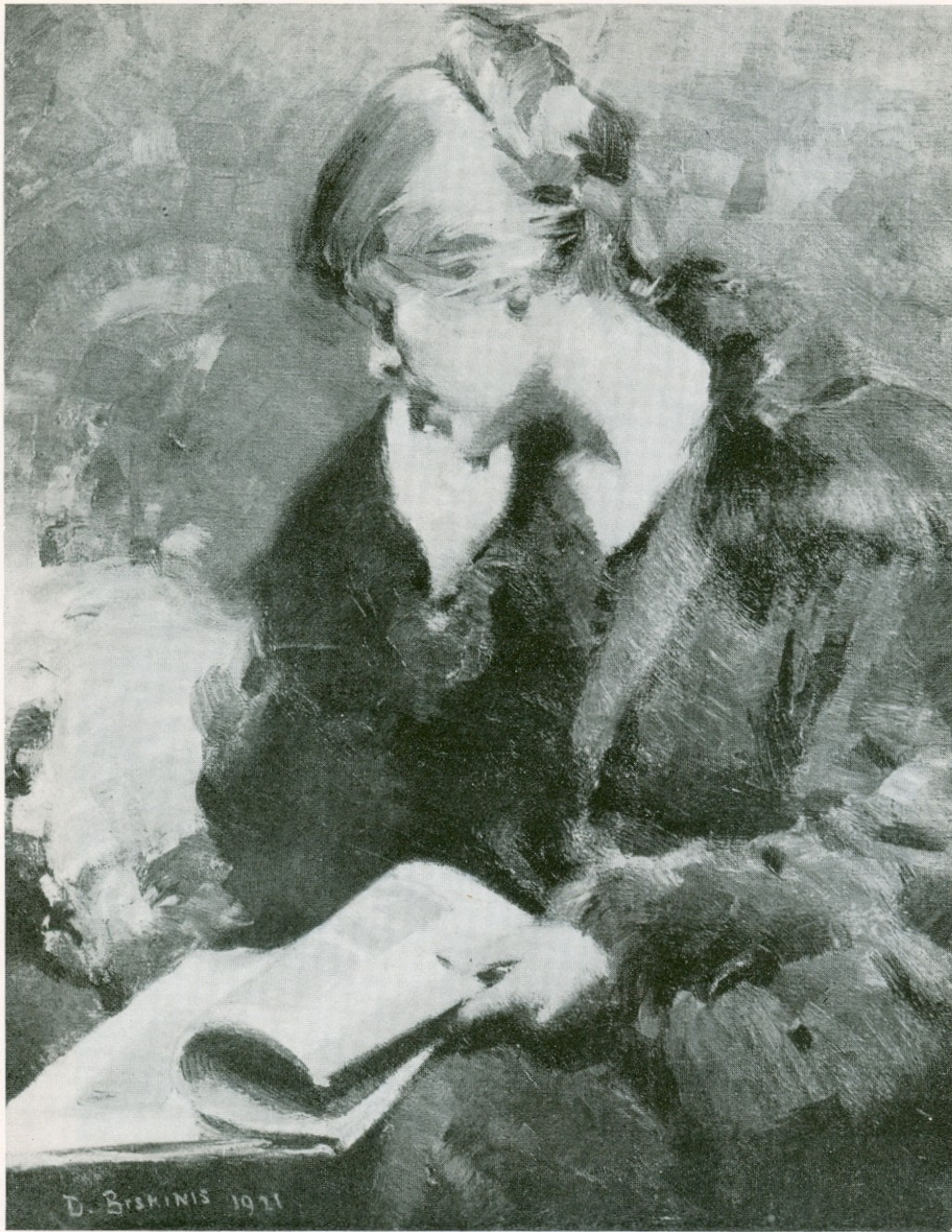
ΝΟΣΤΑΛΓΙΚΕΣ ΑΝΑΜΝΗΣΕΙΣ (1921)