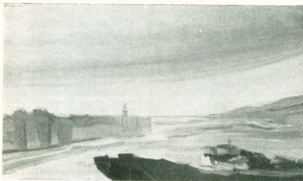
Ρίο - Αντίρριο

Βάγια Παναγιωτόπουλου : «Τέχνη και Έποχή». Αθήναι 1969.