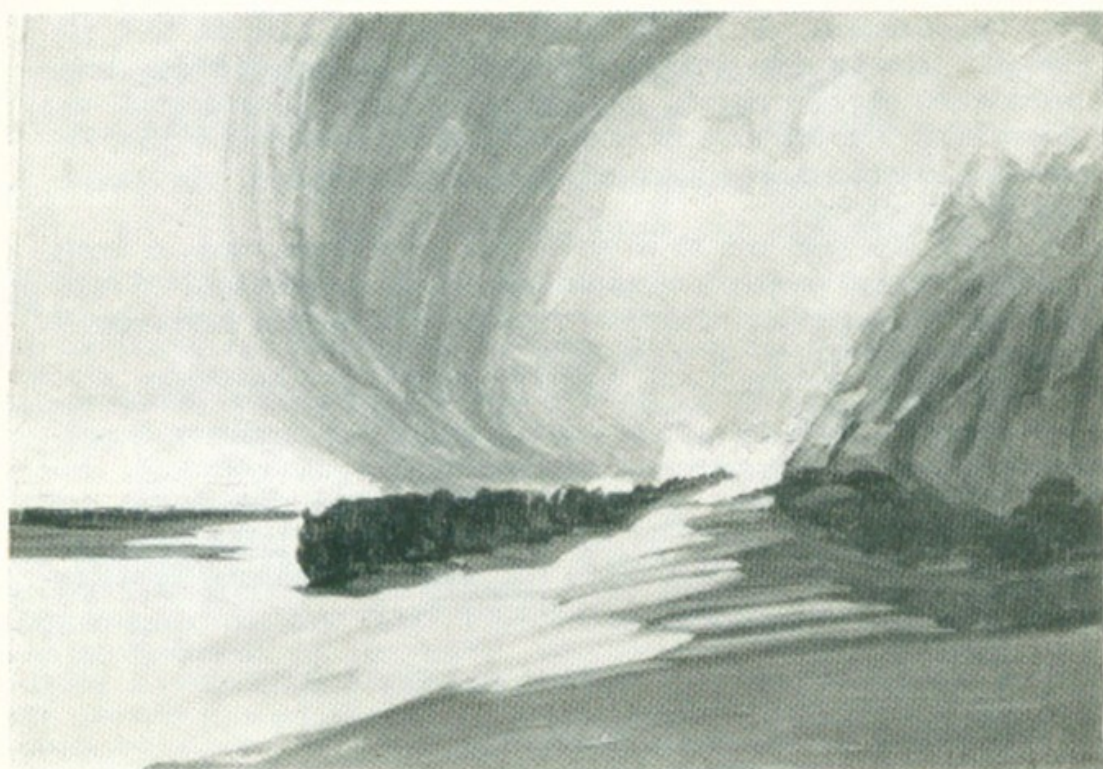
Διάβασις τῆς Ἐρυθραίας