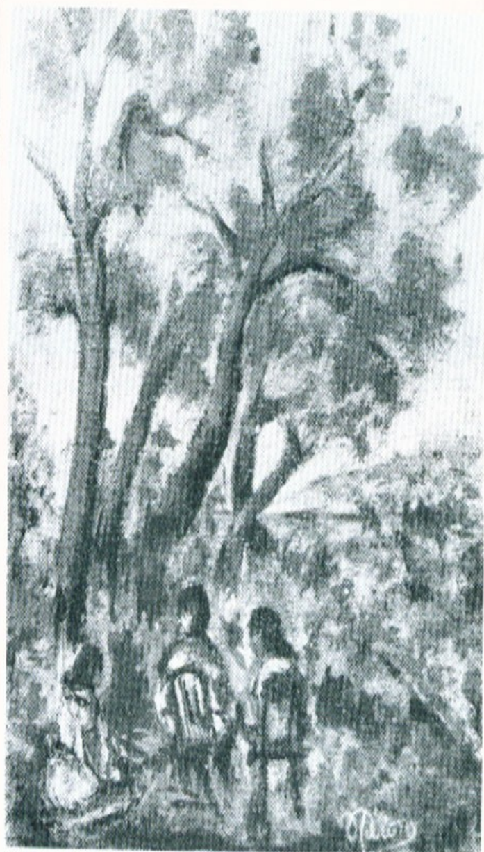
6. Στο ύπαιθρο. Πλαστικό