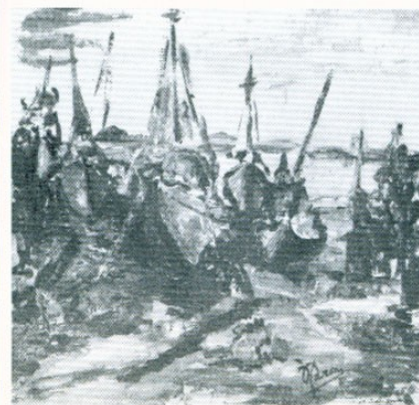
23. Τορσανός. Μονοτυπία