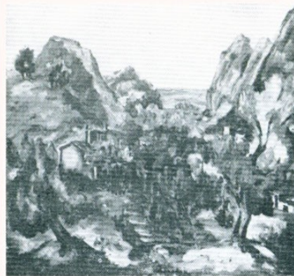
2. Χωριό στη Μυτιλήνη. Λάδι

La revue modern des arts et de la vie 1/9/1967