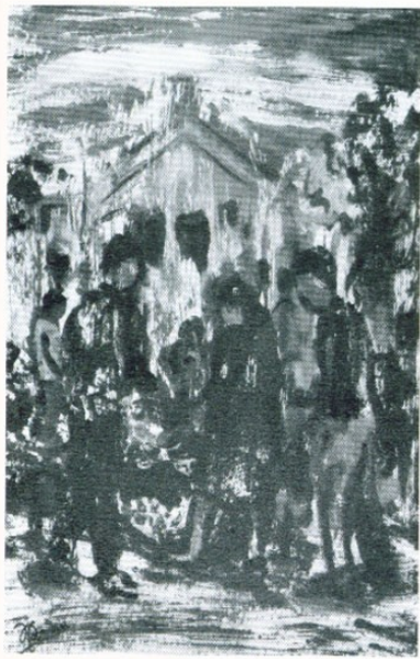
35. Λαϊκή αγορά, Μοναχία

Δέν πρόλαβε ό Όμηρος Πάτσης νά δει τήν τελευταία του έργασία πού έκτίθεται τώρα στίς «Νέες Μορφές».