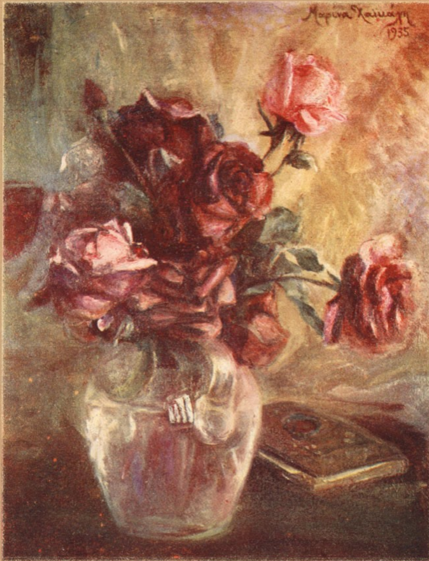
ΜΑΡΙΝΑΣ ΧΑΪΚΑΛΗ - ΣΚΑΡΛΑΤΟΥ