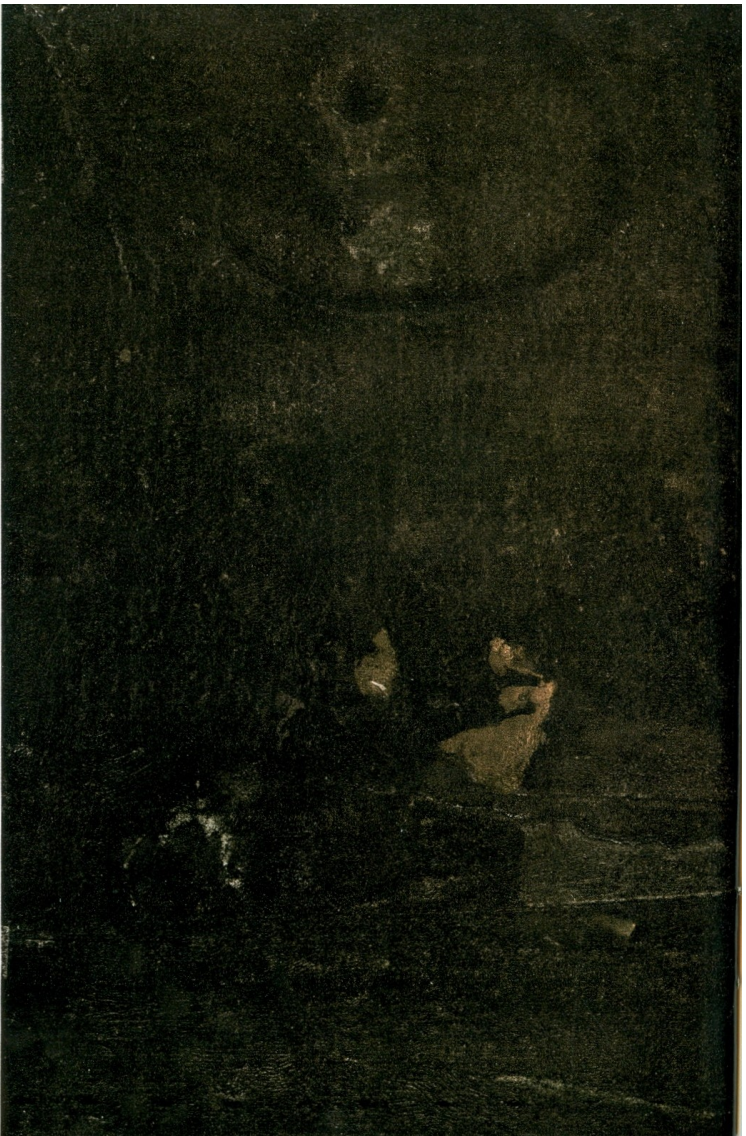
Détail du Triptych C, huile sur toile, 1964