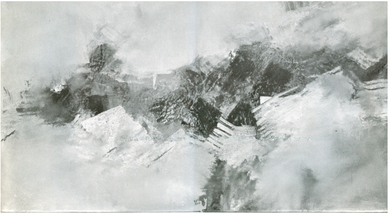
Λάδι, 53X97 (1966) τίτλος : «ακροπόλη»