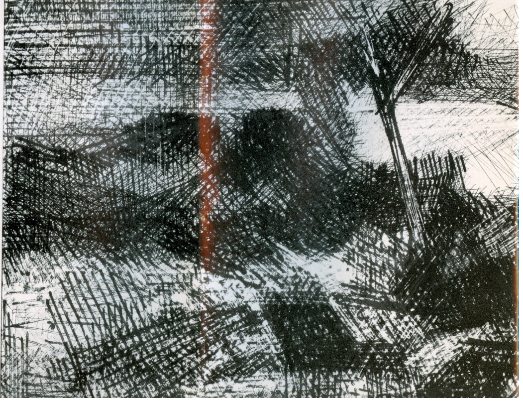
Στέφανο, 0,25 x 0,75 (1966) Τίτλος : «Σταύρος»