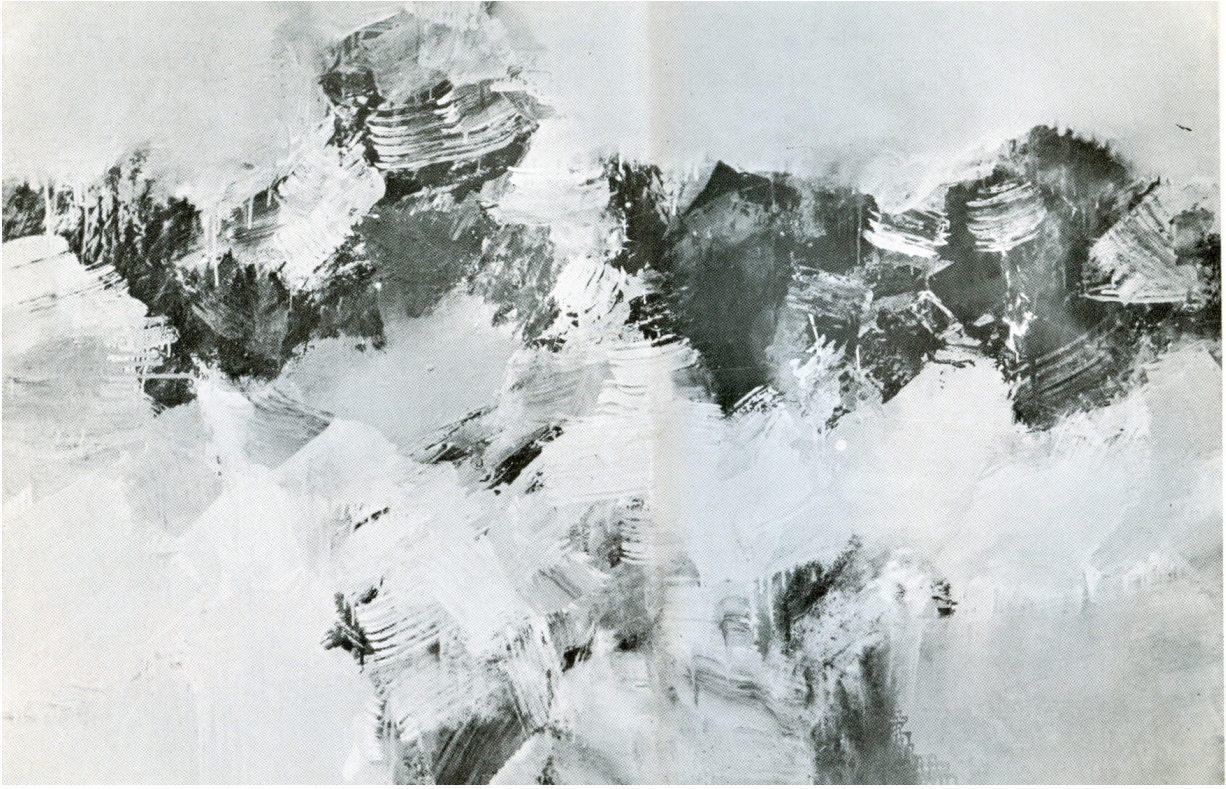
Λαδ. 1,44 x 1,16 (1966) Τίτλος : «Πτέρυξ σὲ πτέρυξ»