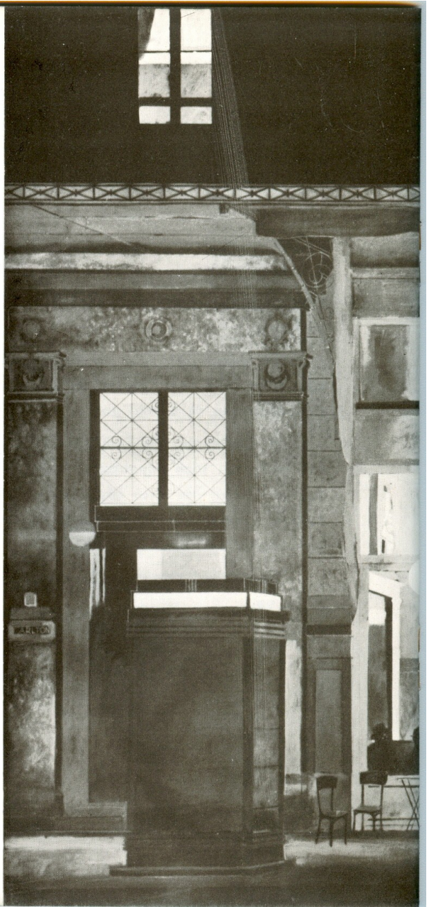
Καφενεῖον Νέον βράδῳ 1,80×1,26 Λάδῳ