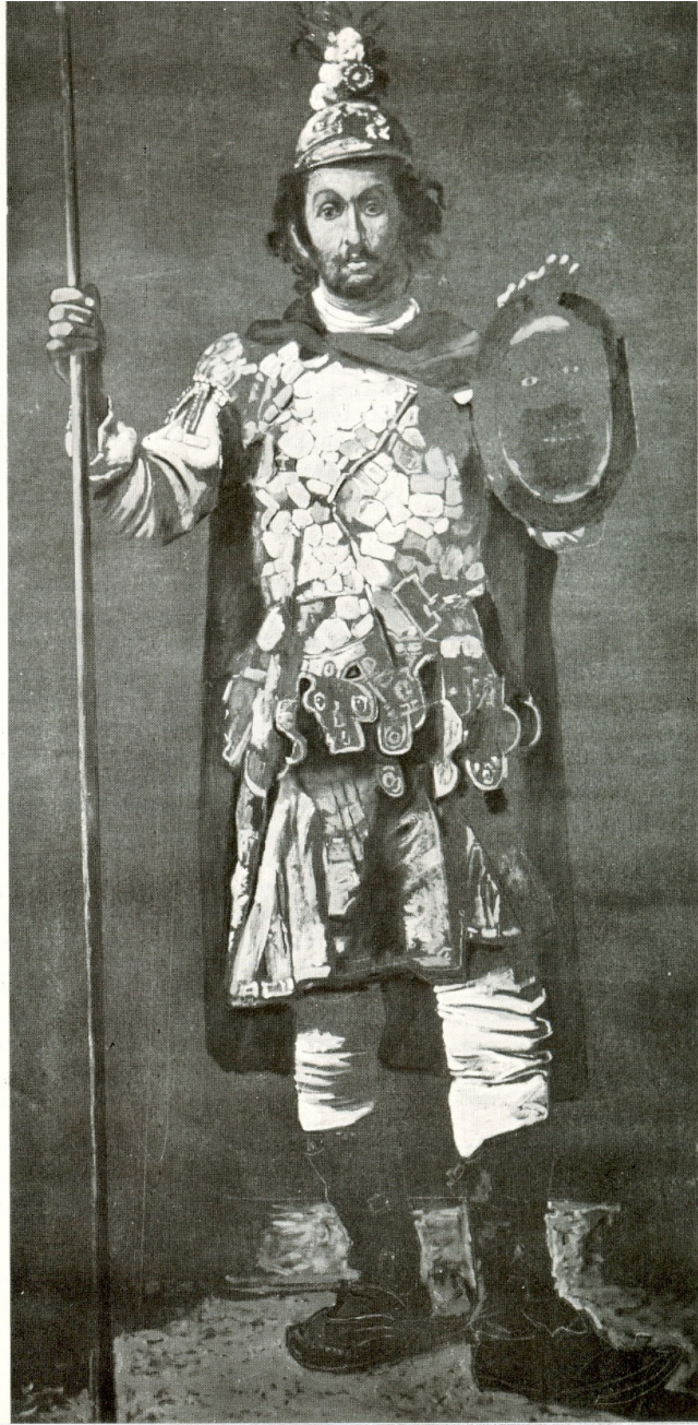
Μελέτη για προσωπογραφία Θεόφιλου 2.20×100 Λάδι