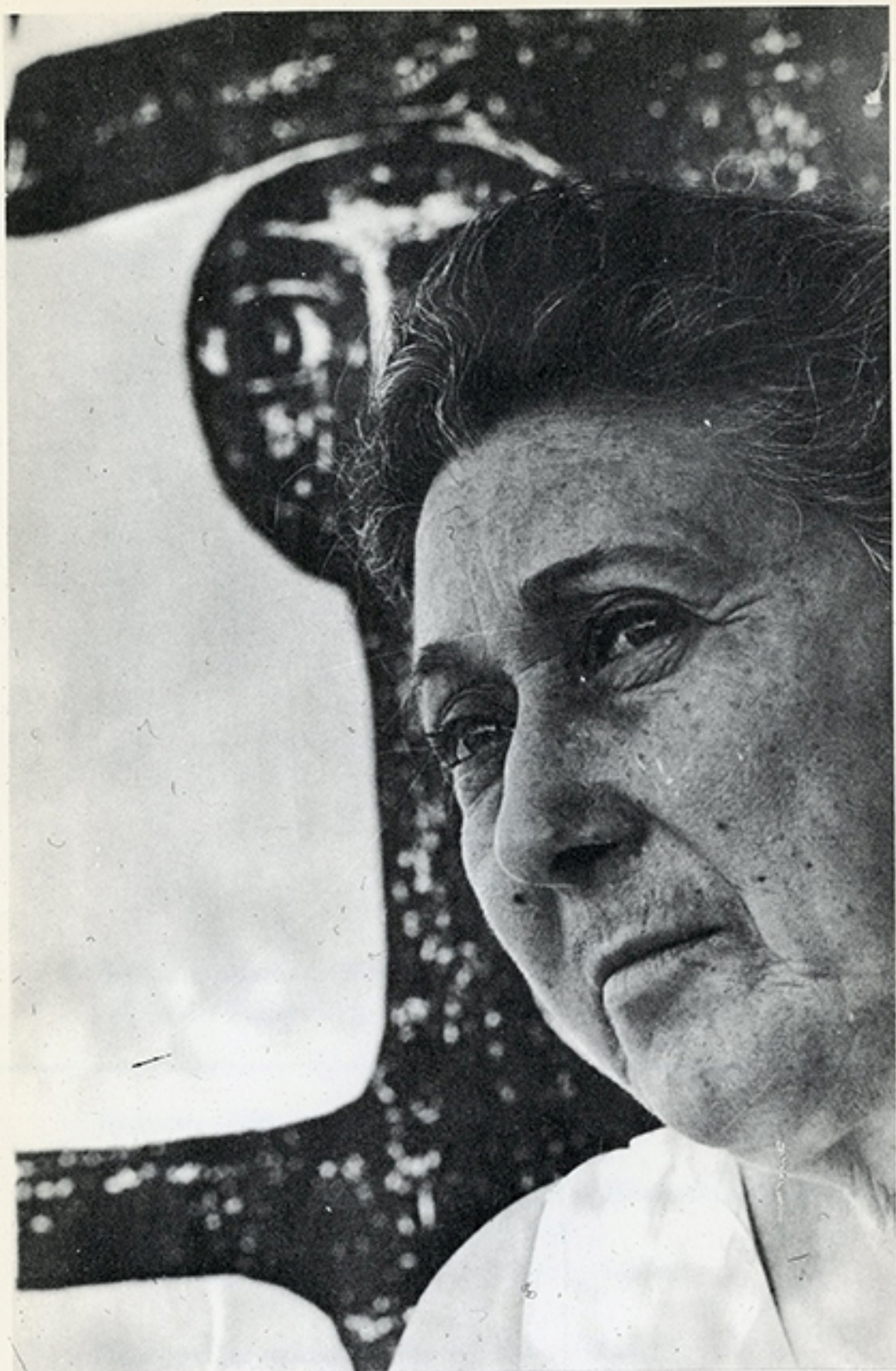
2. Althea's mother