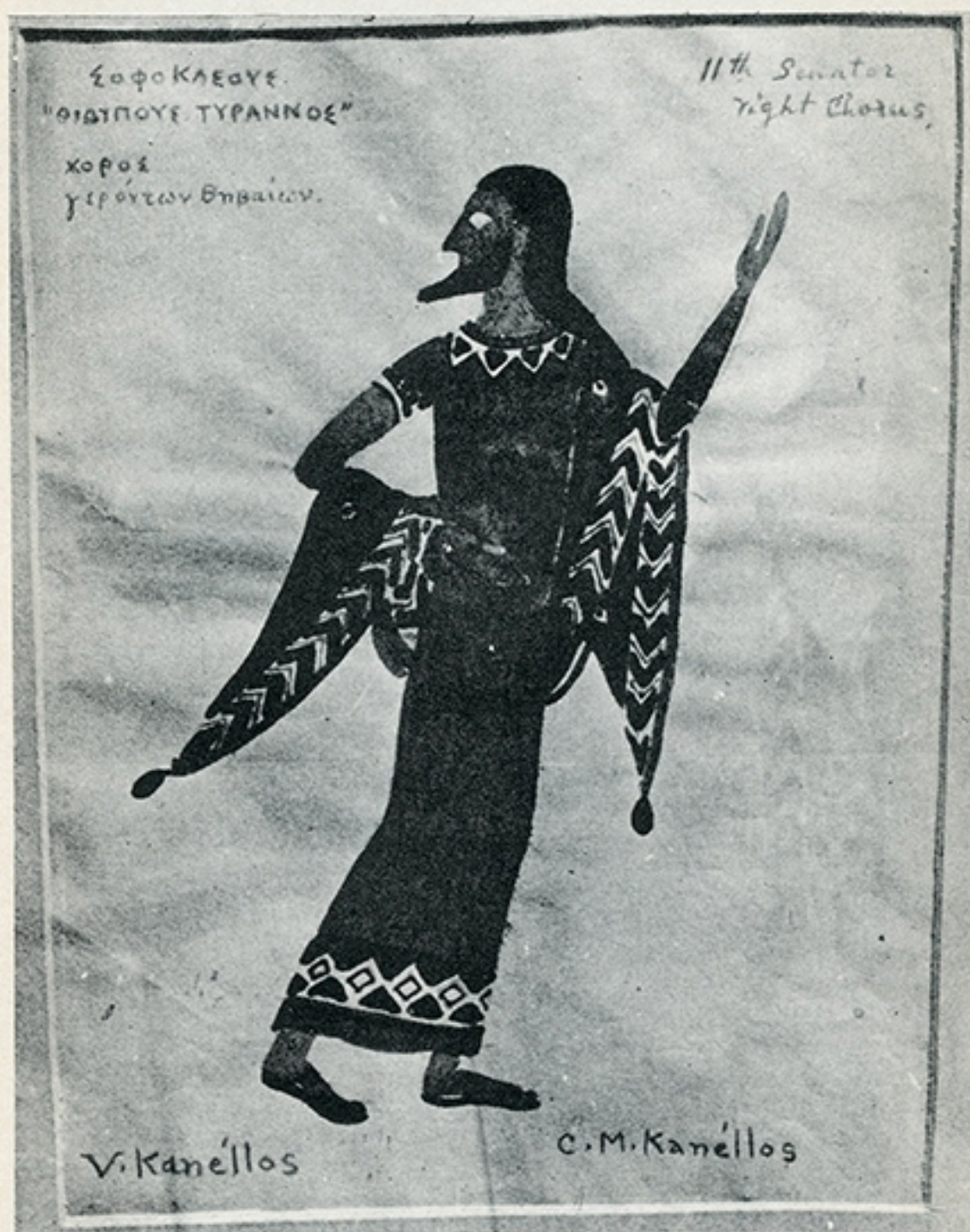
Ἐκ τῶν «Οἰδίποδα τύραννο» χορὸς