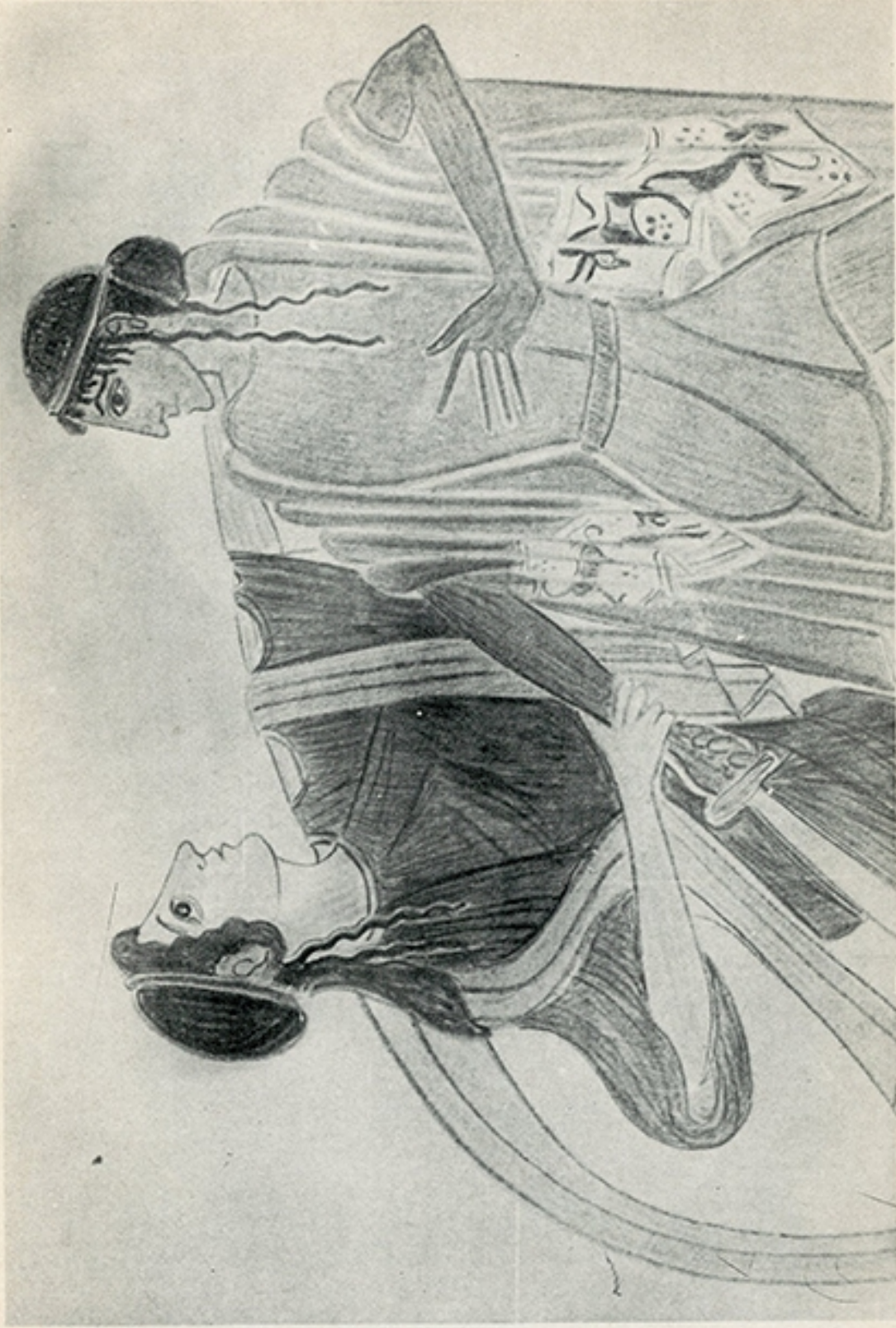
Ἐπί τῶν «Χοιφόρων» Ὁρέστης καὶ Κλυταιμῆστρα