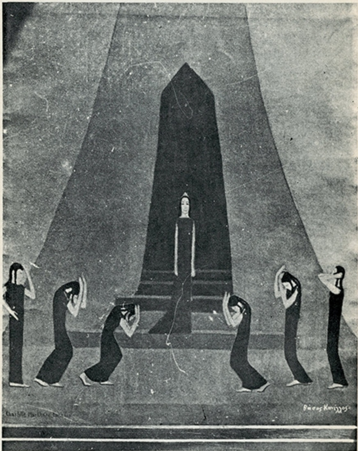
Ἐκ τῆς «Ἐκάβη» τοῦ Εὐριπίδου