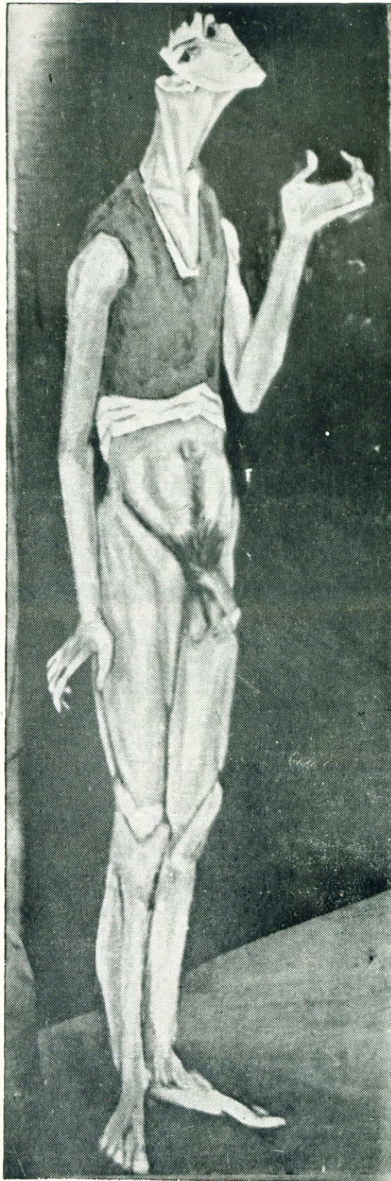
« Νεομάστορος » 57X1,83