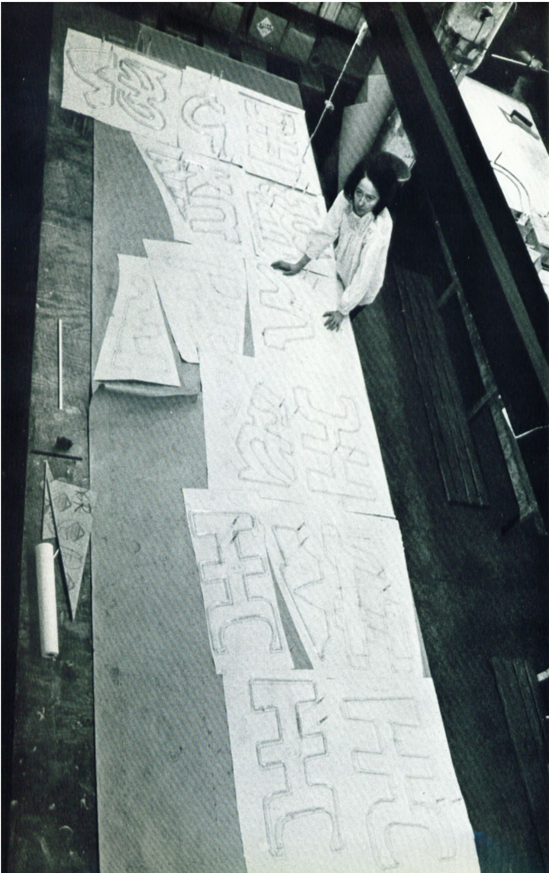
Chryssa travaillant à "The Gates to Times Square dans son atelier de Brooklyn.