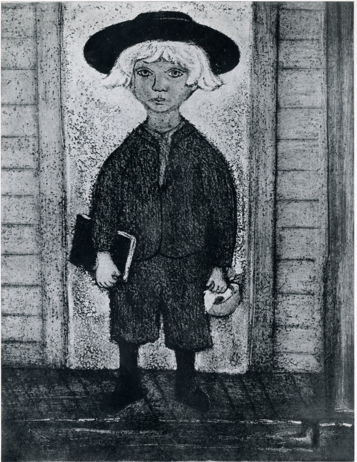
73. Newswanger, Kiehl and Christian. "Amish School Boy," Etching and aquatint.—"Μαθητῆς τῆς αἰρέσεως τῶν Ἄμι., Χαλκογραφία καὶ ἄκουα τίντα.