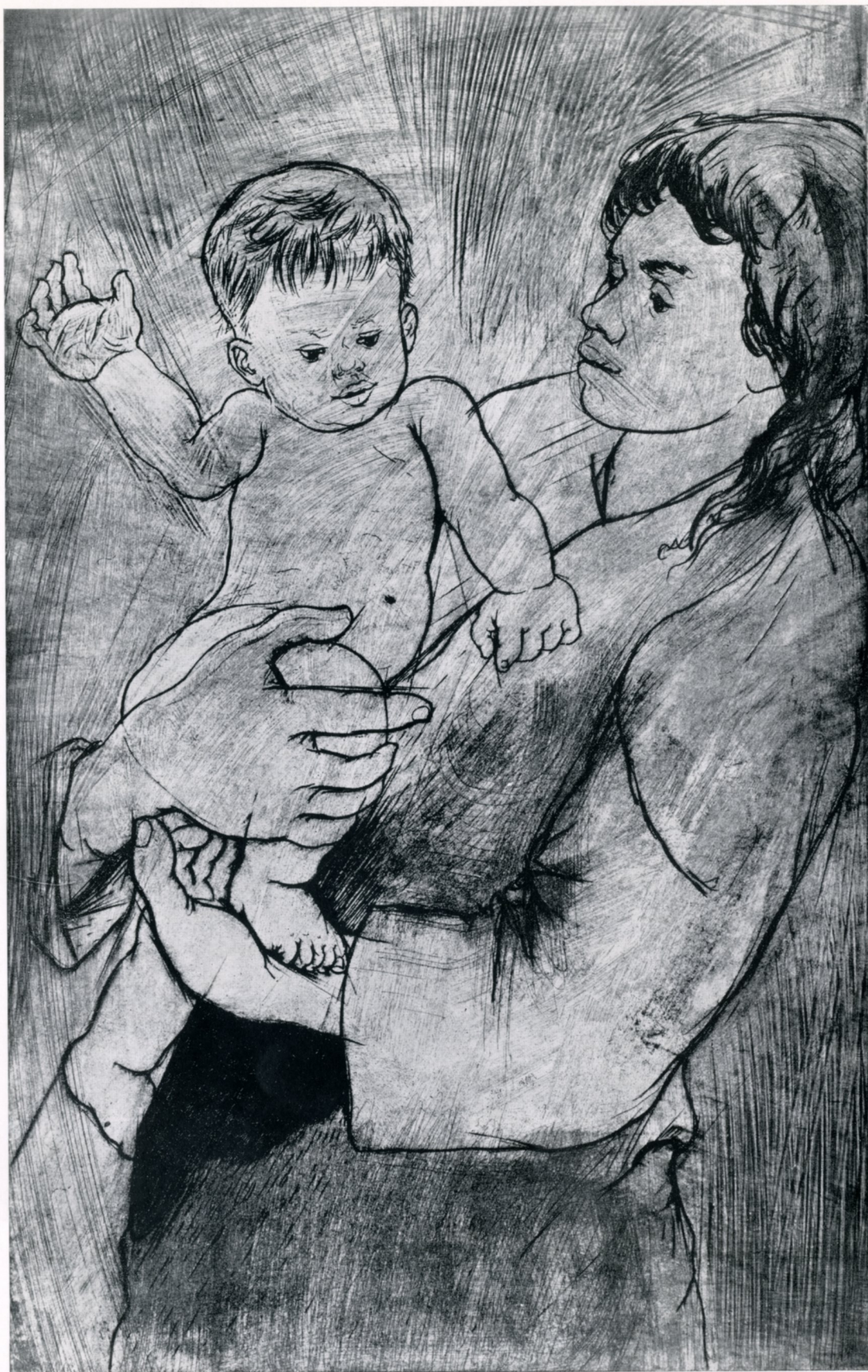
82. Racz, André. "Mother and Child,, Etching.—"Μητέρα και παιδί,, Χαλκογραφία.