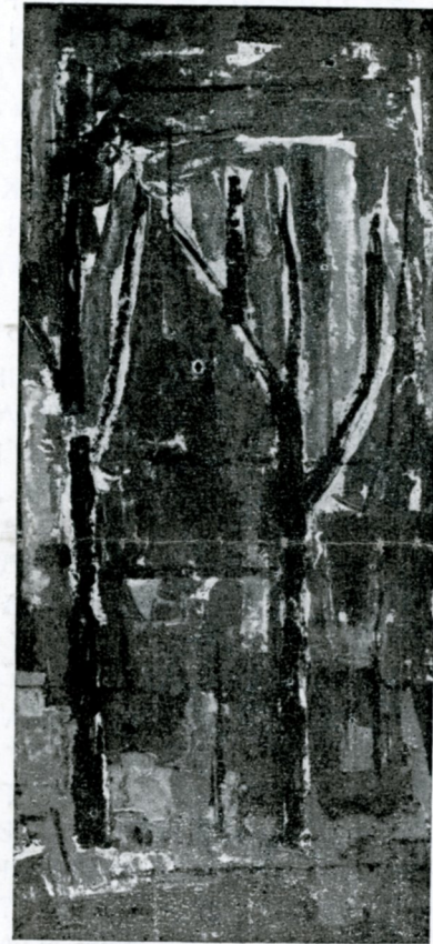
ΧΡΥΣΑΣ ΡΩΜΑΝΟΥ - ΣΤΑΜΑΤΟΠΟΥΛΟΥ :

Τοπίο 1958. Έργο με πλαστικό χρώμα. Βραβείο θερινού Σαλόν 1958, της Γκαλερί Ζυγός.