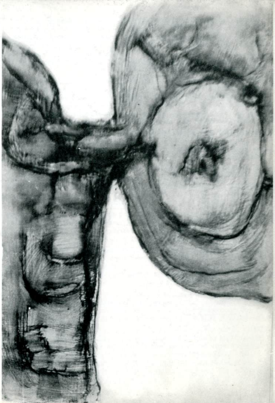
CH. ROMANOS "Mythe,, 1963