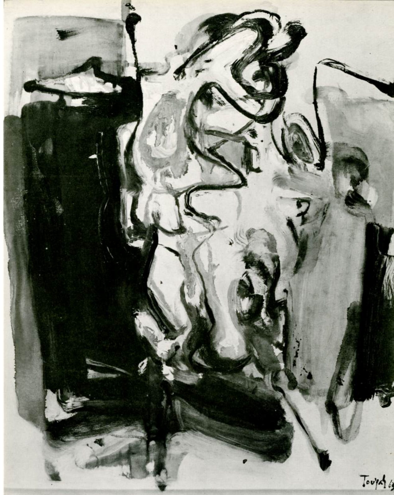
Τούγιας σύνθεσις λάδι, 1963 Touyas Composition