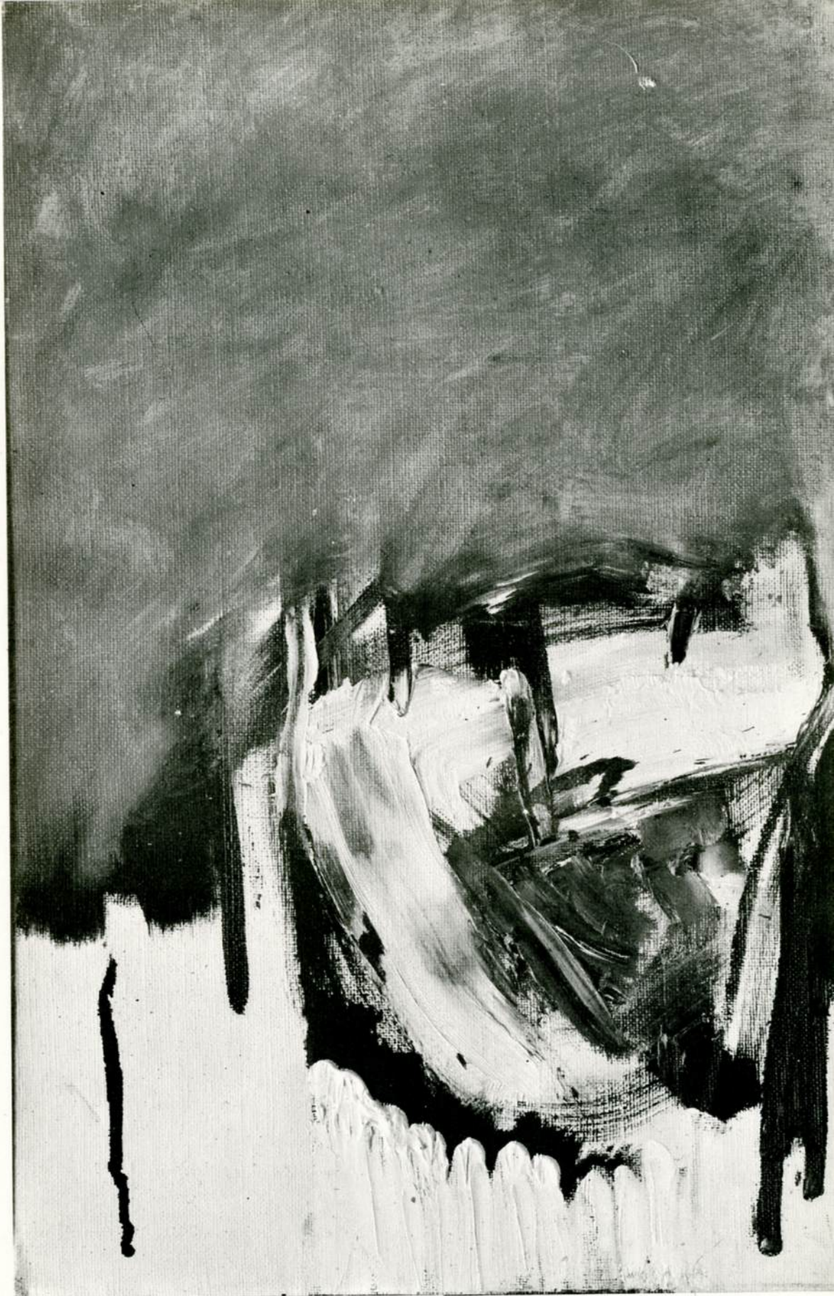
Μολφέσης σύνθεσις λάδι, 1963 Molfessis Composition