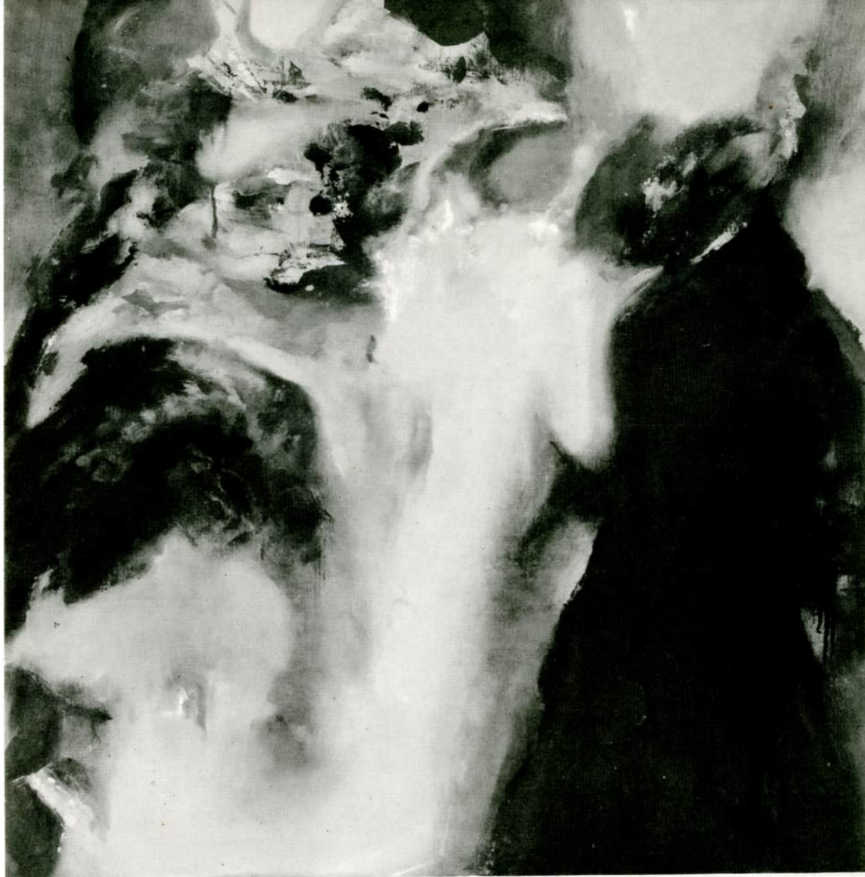
Βαφειάδης ζωγραφική λάδι, 1963 Vafiadis titre peinture