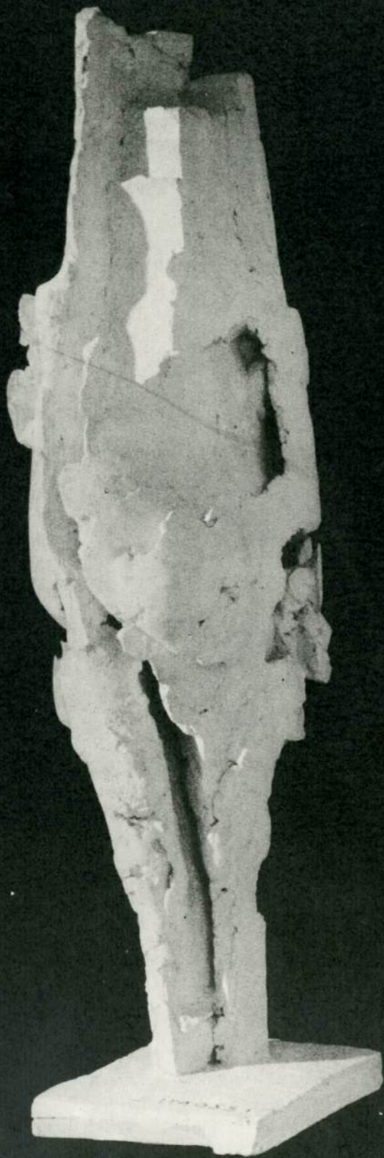
Σίμωσι φιγούρα, 1962 Simossi Figure (platte)