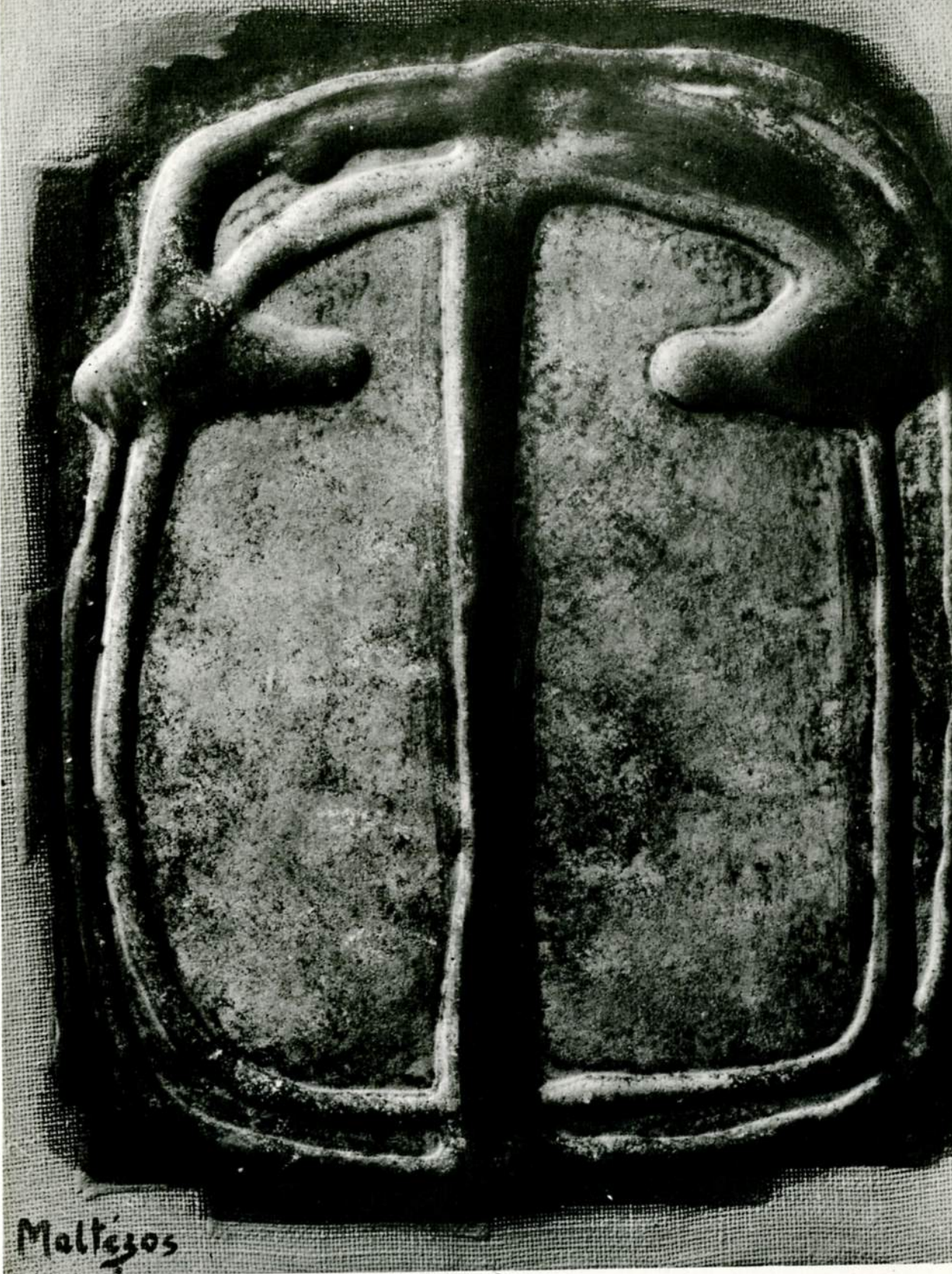
Μαλτέζος ζωγραφική λάδι, 1963 Maltezos peinture