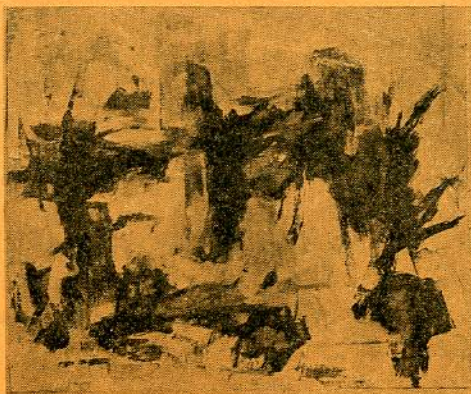
Κ. ΝΑΤΣΗ ΑΓΚΑΘΙΕΣ