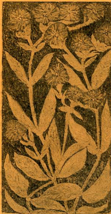
Ν. Γ. ΠΕΝΤΖΙΚΗΣ ΑΓΡΙΟΛΟΥΛΟΥΔΟ ΤΟΥ ΧΟΛΟΜΩΝΤΑ Γ. ΠΑΡΑΛΗΣ ΠΑΡΑΜΟΝΗ ΕΘΝΙΚΗΣ ΕΟΡΤΗΣ