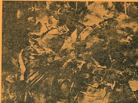
Ο. ΓΕΩΡΓΙΑΔΗΣ ΟΥΤΟΠΙΑ