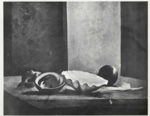
Νεκρὴ φύση Still life