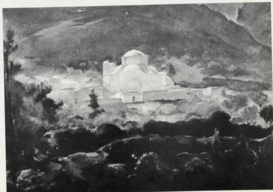
Ἡ ἐκκλησία τοῦ χωριοῦ The village church