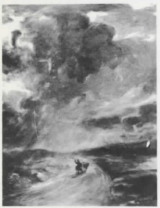
Ἡ ὑπὸ αὐρῆς Συλλογή Π. Γονέου, Ἀθήναι Approaching Storm P. Goneos collection, Athens