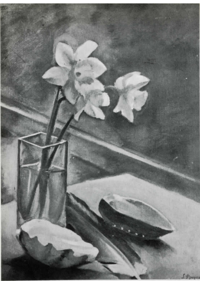
Χρώματα και σχήματα με αντικείμενα Colours and shapes with objects