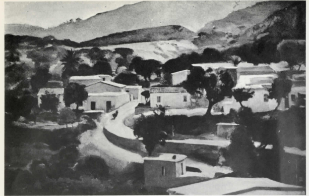
Κυπριακὸ χωριό Cyprus village