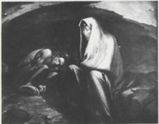
Πιετὰ 1966 Pieta 1966