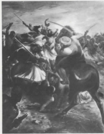
Ἐξοδὸς τοῦ Μεσολογγίου Δημοτικὸν Μέγαρον Μεσολογγίου Exode of Missolonghi Town-hall of the city of Missolonghi