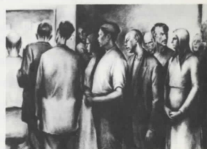
Ἀναφορὰ Λονδίνου 1972 Expectation London 1972

C.A.P.P. - CENTRO ARTISTICO «PADRE PIO» Convento Cappuccini - 71013 S. GIOVANNI ROTONDO (FG)