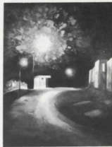
Μία νύκτα Ἰνστιτούτο Κοινοπολιτείας Λονδίνου 1970 One night Commonwealth Institute London 1970