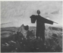
Σκιάτρες Σαλὸν Μοντέρνας Τέχνης Παρισιῶ 1961 Scarecrows Salon d'Art moderne of Paris 1961