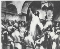
Μήνυμα Ἐλευθερίας Μουσείον Πούσκιν, Μόσχα Message for freedom Pushkin Museum Moscow