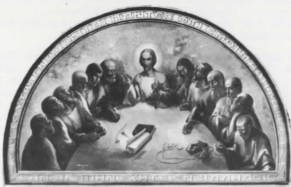
Καὶνὰ Διαθήκη Ἀργυρῶν μετάλλιον τῆς «Μπιενάλε ντ' Ἀρτε Σάκρα» εἰς Φούτζια 1972 New Testament Silver medal of the "Biennale d'Arte Sacra" in Foggia, 1972