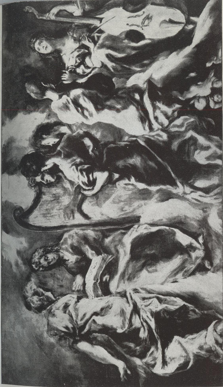
III N. 1. Δ. ΘΕΟΤΟΚΟΠΟΥΛΟΥ : Ἡ συναυλία τῶν ἀγγέλων.