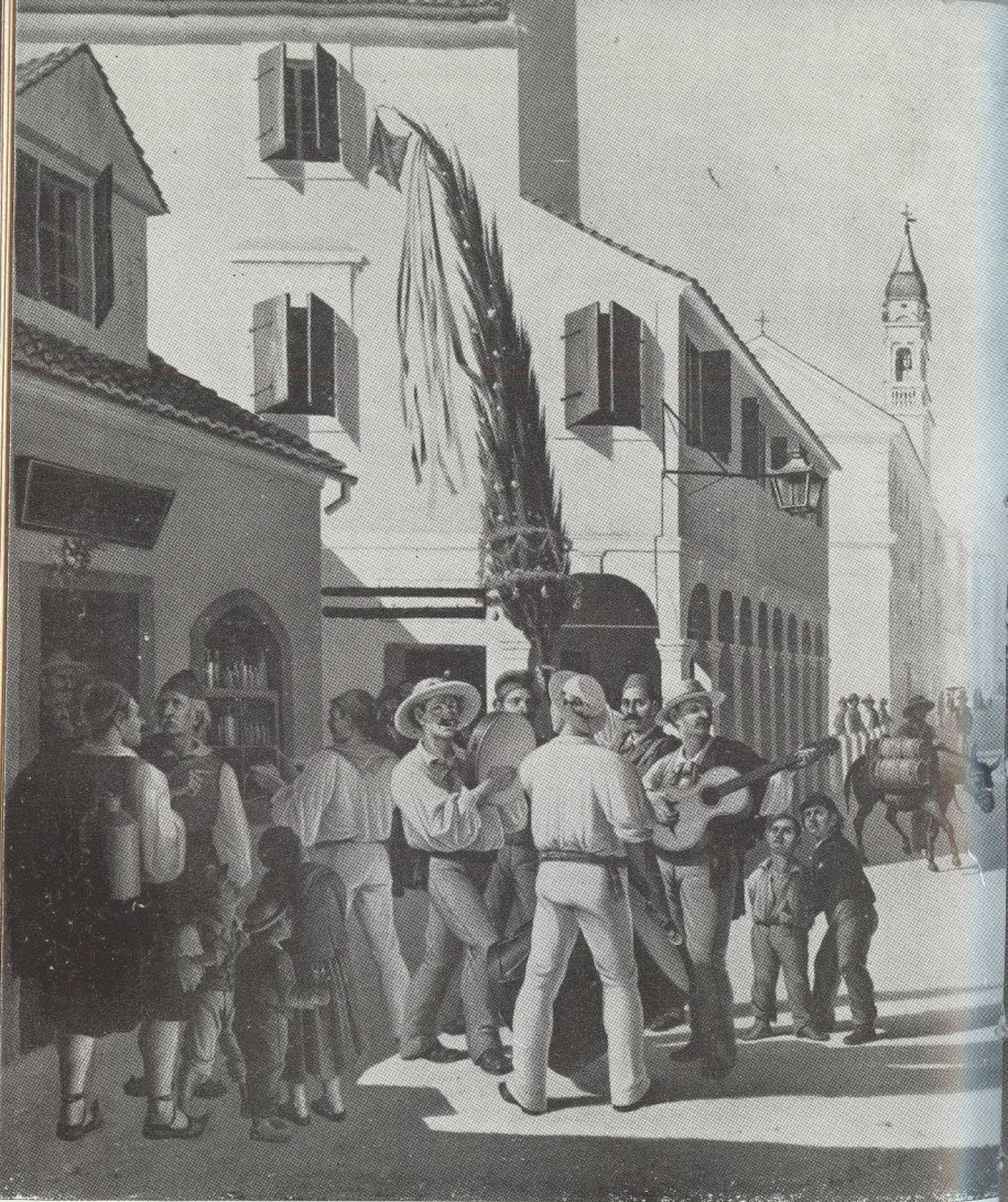
ΠΙΝ. 6. Χ. ΠΑΧΗ : Προτομαγιά στην Κέρκυρα. ↑