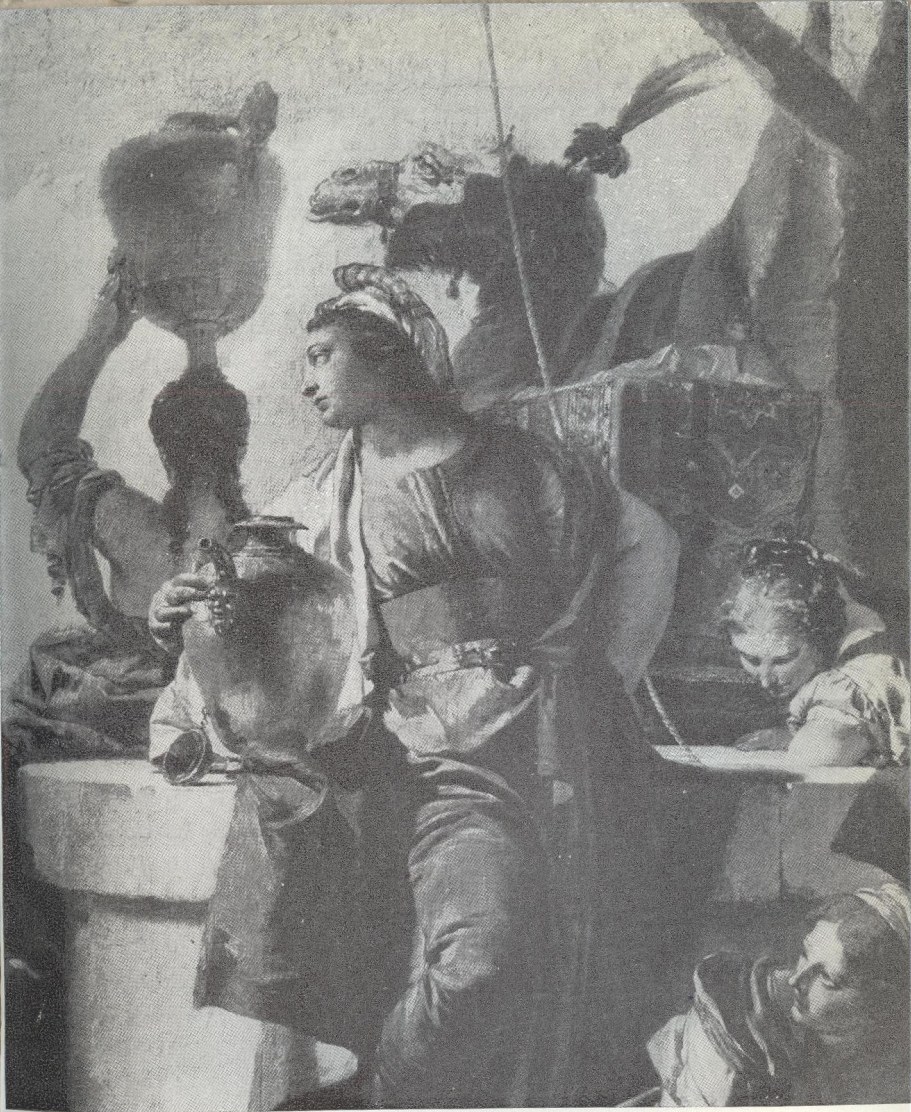
ΠΙΝ. 3. Γ. Β. ΤΙΕΡΟΛΟ: 'Ελεάζαο και Ρεβέκκα. (Τμήμα).