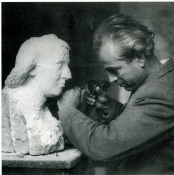
"Δουλεύοντας ένα πορταίτο"