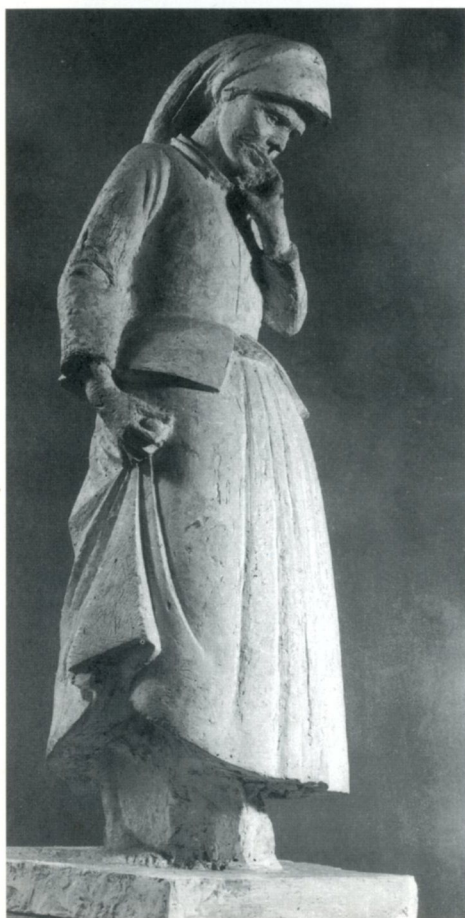
"Η Μάνα μου"