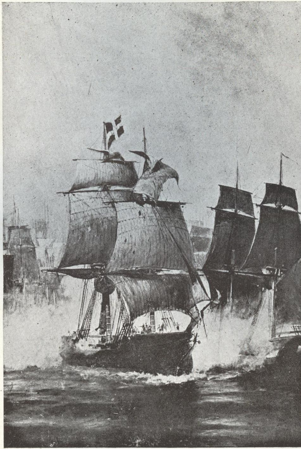
Ο « ΑΡΗΣ »