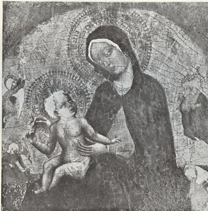
Η ΘΕΟΤΟΚΟΣ ΜΕΤΑ ΤΟΥ ΒΡΕΦΟΥΣ